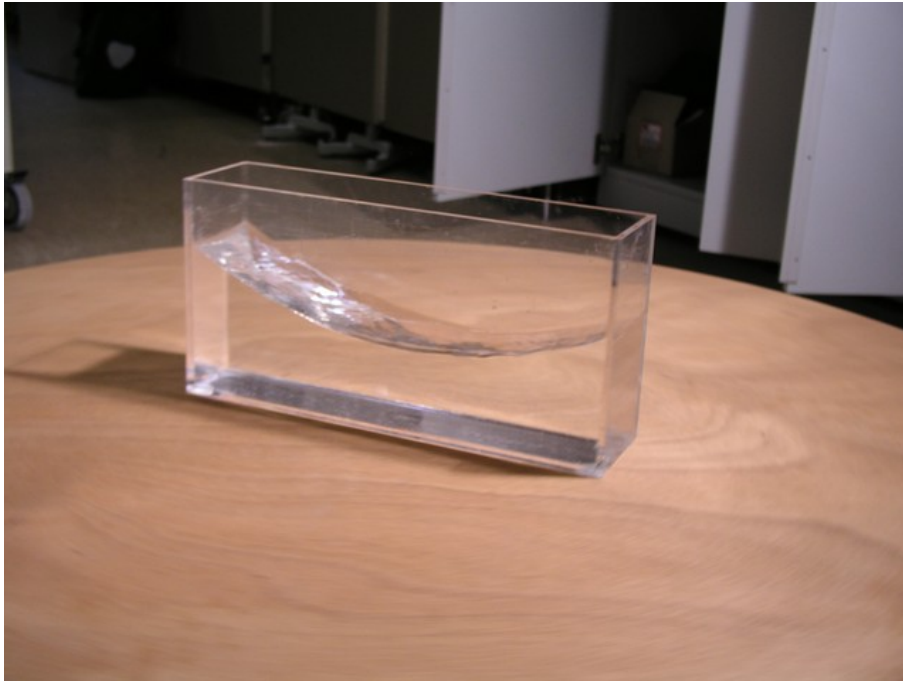
Abb. 1: Wasserbehälter auf rotierender Oberfläche