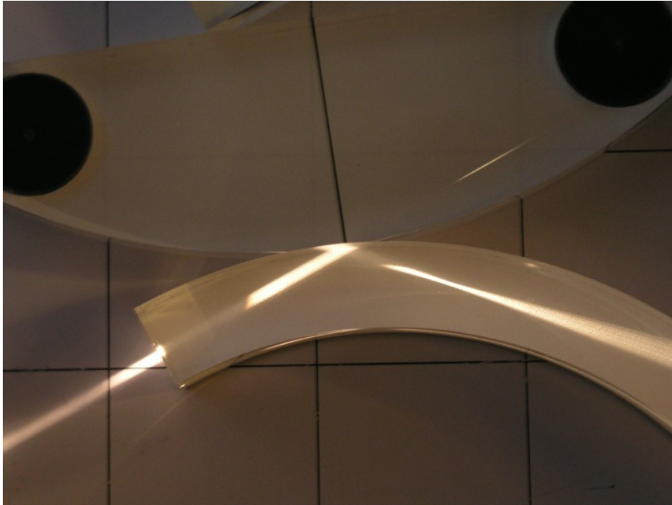
Abb. 4: Ein Lichtstrahl wird durch Berührung der Oberfläche an der Totalreflexion stattfindet ausgekoppelt