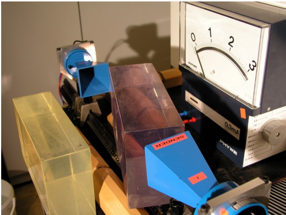
Abb. 1: Mikrowellen werden am Übergang Harz/Luft total reflektiert, der Empfänger detektiert kein Signal.