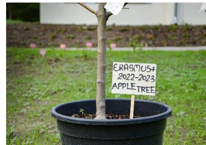
Baum eingepflanzt beim Goodbye-Workshop

Sportangebote vom AZS UMK (leider nur auf polnisch):