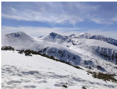
Schneewanderung in Zakopane

Da in meinem Wohnheim und bei meinen Uni-Kursen größtenteils Erasmus-Studierende waren, hatte ich weniger mit Einheimischen zu tun. Ich hatte jedoch eine sehr nette und hilfsbereite Mentorin, die sich sehr gut um meine Mitbewohnerin und mich gekümmert hat und mit der ich mich angefreundet habe.