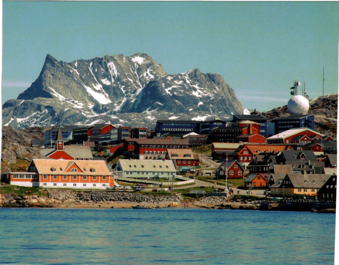
vorne links: das ehemalige Hospital und jetzige Seminargebäude der PH

Im Jahr 1979 hatte Grönland (mit lediglich 55.000 Einwohnern) die innenpolitische Selbstverwaltung vom Mutterland Dänemark zugesprochen bekommen. Einer der ersten Beschlüsse der neuen Regierung betraf die Sprachenregelung in den Schulen: Ab sofort sollte nur noch in der wichtigsten Inuit-Sprache unterrichtet werden, was schon deshalb sehr schwierig war, weil es ein knappes Dutzend verschiedener Inuit-Sprachen gibt, die untereinander nicht verstanden werden. Nach 7 Jahren wurde das Sprachen-Experiment abgebrochen, weil die Inuit-Schüler nun nur noch wenig Dänisch und überhaupt kein Englisch lernten. Die Folge: Sie konnten nicht einmal ins Internet gehen. Seither werden diese Jahrgänge als „lost generation“ bezeichnet.