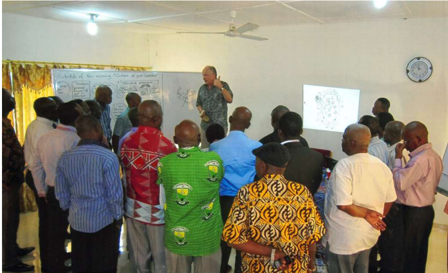
Eine „Sprechmühle“ mit dem Ziel, die verinnerlichte persönliche Methodentheorie bewusst zu machen

Nach dem Besuch von Ho geht es weiter an das Vocational Institute in Alavanyo – eine große berufsbildende Schule, die stark von der EKD (Evangelische Kirche Deutschlands) unterstützt wird.