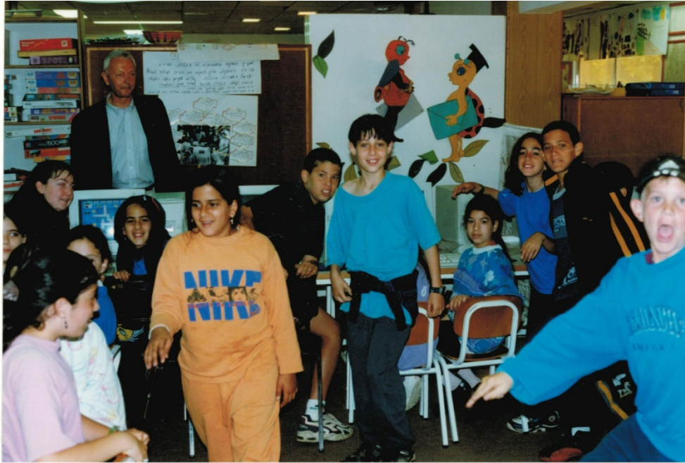
Elementary School „Ma’ayanot“ im Kibbutz Cabri: Die Schule hat ein anspruchsvolles Individualisierungskonzept und arbeitet inklusiv.