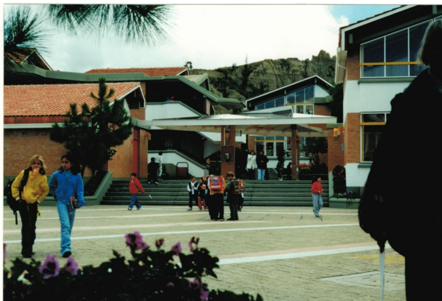
Eingangsbereich Deutsche Schule La Paz

Der Schulleiter bittet mich, zusätzlich zur ganztägigen Fortbildung (zu den Themen „Unterrichtsqualität“ und „Methodenvielfalt“) einen Workshop zum Thema „Erziehungsverwahrlosung“ anzubieten. Der Grund: Immer mehr Schüler deutschstämmiger Großgrundbesitzer verlieren allen Respekt vor Lehrer*innen und Polizisten. 1