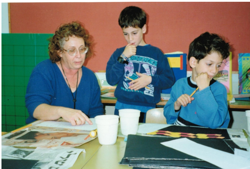
Die Lehrerin gibt eine Rückmeldung zum individuellen Arbeitsergebnis.