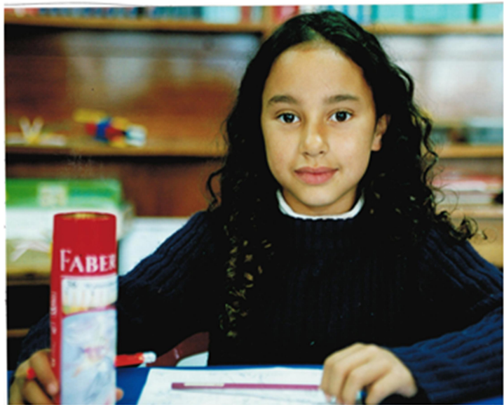
Neuseeland (2005): voll integriertes Maori-Kind mit einer Ausstrahlung wie der der Hauptfigur aus dem Film „Whale Rider“ (2002)

Jedes Kind, das den 5. Geburtstag hat, wird in Neuseeland an diesem Tag schulpflichtig. Das zwingt die engagierte und wirklich fitte Lehrerin zwangsläufig, ein hohes Niveau der inneren Differenzierung umzusetzen. Sie nutzt die Jahrgangsmischung und hat ein gut funktionierendes Helfersystem aufgebaut. Zwischendurch kommt eine Mutter vorbei und verteilt an alle Kinder Obst und Gemüse. (Warum geht das nicht in Deutschland?) Die Schule droht geschlossen zu werden, weil sie zu klein wird. Deshalb ist die Lehrerin glücklich, von drei oder vier schwangeren Frauen gehört zu haben.