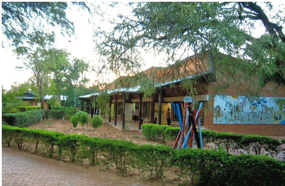
Die Johann-Cornies-Schule in Filadelfia

Grundschulunterricht: Domenika Eitzen, unsere Gastgeberin, unterrichtet in der Klasse 2 der Johann-Cornies-Elementarschule. 5