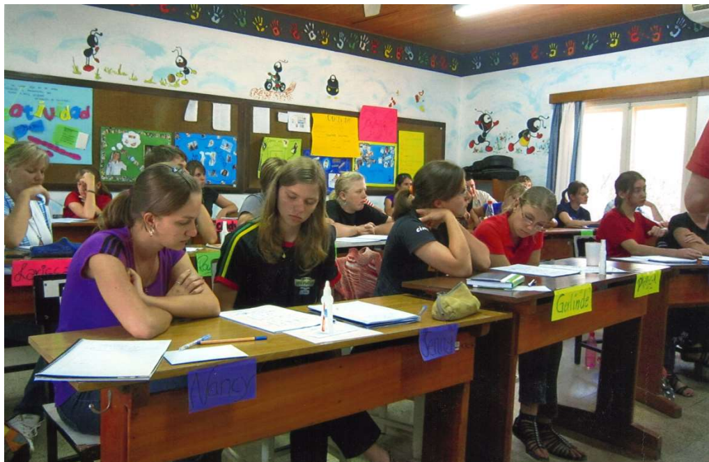
Erstsemester 2013 bei der Fortbildung mit HM

Mein Zwischenfazit: Dort, wo ein reger schulpädagogischer Austausch stattfindet, wird eher „offener Unterricht“ praktiziert und es gibt ein höheres Niveau der Individualisierung des Lernens.