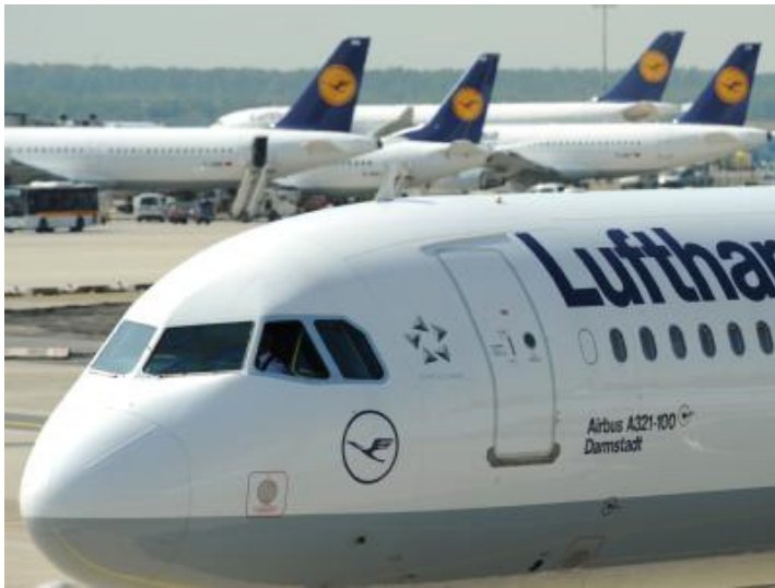
Die Deutsche Lufthansa gehört zu den Unternehmen, die auch eigene Blogs für ihre Kunden betreiben.

Berlin (dpa) - Mehr als die Hälfte der 100 deutschen Marken mit den höchsten Werbeausgaben nutzen Online-Netzwerke wie Twitter und Facebook. Dies geht aus einer Studie der Universität Oldenburg und der Werbe- und Onlineagentur Konstruktiv hervor.