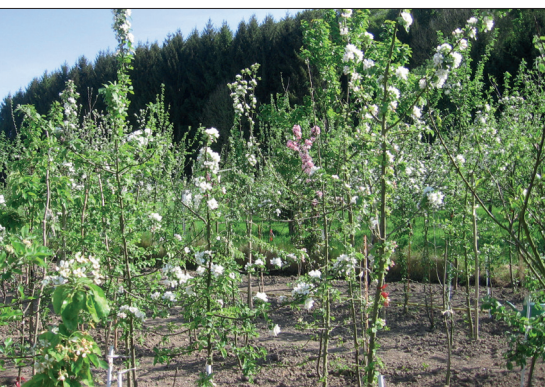
Abb. 3: Zuchtgarten Bielefeld