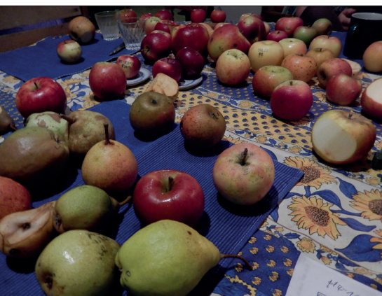
Abb. 5: Fruchtselektion

Wir wollen unserem Planeten nicht noch ein irreversibles, in die Ökosysteme eingreifendes Experiment zumuten (wie beispielsweise Atommüll, Plastikmüll, ...). So arbeiten wir mit der ganzen Pflanze und orientieren uns an dem, was sie uns zeigt [Abb. 3].