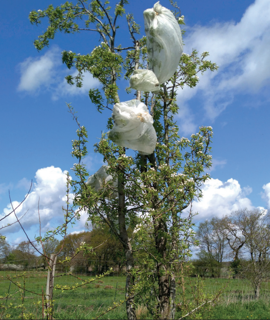
Abb. 2: Birnenkreuzung in Hollingstedt