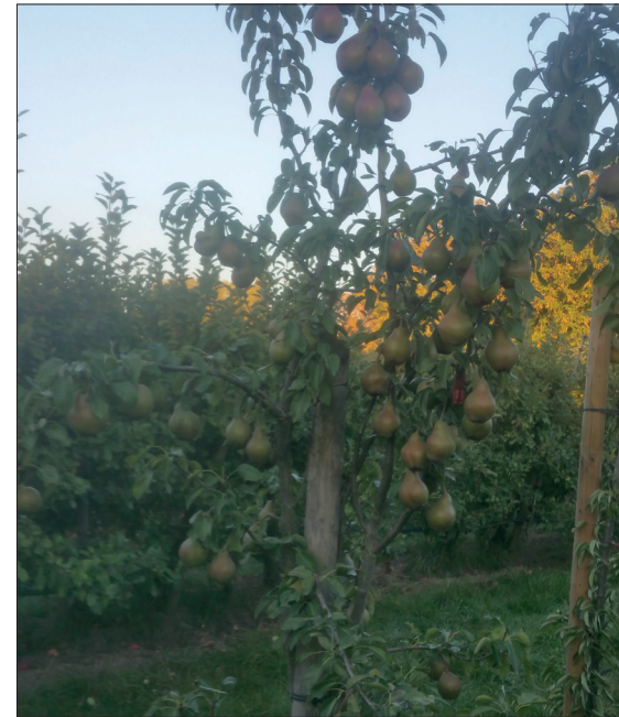
Abb. 7: B18, Zuchtgarten Wesel

Stifter und Spender, dem Saatgut e.V., dem Zuspruch aus der FÖKO, der Zusammenarbeit mit Projektpartnern und dem Austausch mit erfahrenen Züchtern, wären wir nie so weit gekommen. Vielen Dank an dieser Stelle. Aus den ersten Pflänzchen sind fruchttragende Bäume gewachsen, bis zur Sortenanmeldung brauchen wir noch einen langen Atem.