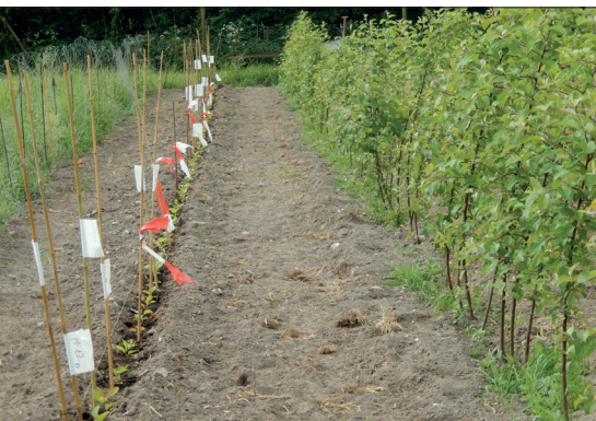
Abb. 4: Zuchtgarten Hollingstedt