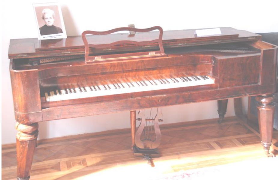
Das Klavier Paul Constantinescus im Paul Constantinescu Museum in Ploiești, Rumänien.

Als Pianistin und Cembalistin des Wallfisch-Duos errang sie internationale Anerkennung und konzertierte in den Vereinigten Staaten, Kanada, Europa, Nord-Afrika und Israel, wobei sie sowohl solistisch, als auch kammermusikalisch in Erscheinung trat. Sie nahm an den internationalen Musikfestivals in Edinburgh, York, Venedig und Besançon teil sowie am Menuhin-Festival in Gstaad (Schweiz) und am Casals-Festival in Prades (Frankreich). Lory Wallfisch ist eine sehr erfahrene Pädagogin. Sie unterrichtete in Bukarest, Cleveland und Detroit, bevor sie im Jahre 1964 mit ihrem späteren Ehemann dem Smith College beitrug. Ihre Tätigkeit als Pädagogin umfasst Meisterkurse in den USA, in Österreich, Deutschland, Italien Frankreich, Irland, England Australien und Schweiz.