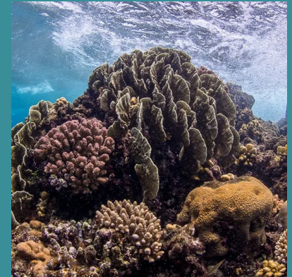
Bunte Korallendiversität im Roten Meer