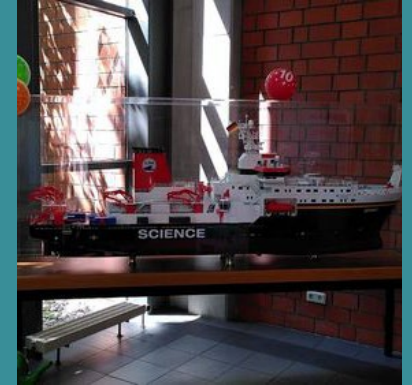
10 Jahre SONNE