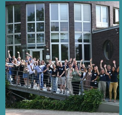
Teilnehmende und Sprecher*innen des 7. ICBM-Doktorand*innen- Tages