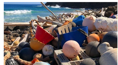
Mit Hilfe von Fernerkundungsverfahren sollen die Ausbreitung des Mülls beobachtet und Aufräumaktionen geplant werden.