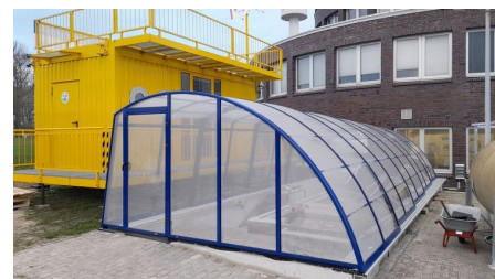
Ensemble in Komplementärfarben: Der gelbe Schaucontainer ist das zukünftige Kontrollzentrum für Echtzeitmessungen im überdachten Außenbecken des ICBM

Zuletzt jedoch waren es aufgrund der kosten- und personalintensiven Einsätze nur noch wenige Gelegenheiten, zu denen der leuchtendgelbe Showroom genutzt wurde. Nachnutzungsmöglichkeiten waren gefragt. Hatte man zwischenzeitlich sogar erwogen, den Container an Interessierte abzugeben, ergab sich jetzt die Möglichkeit für ein „zweites Leben“ des mit zwei Türen, einem großen dreiflügeligen Fenster, einer Heizung, EDV-Leitungen, Deckenbeleuchtung und hydraulischen Stempeln zur Höhenverstellung ausgestatteten Schaucontainers. Eines der Außenbecken war kürzlich mit einer zu öffnenden Poolüberdachung versehen worden, die auch wetterunabhängige Experimente erlaubt. (SR)