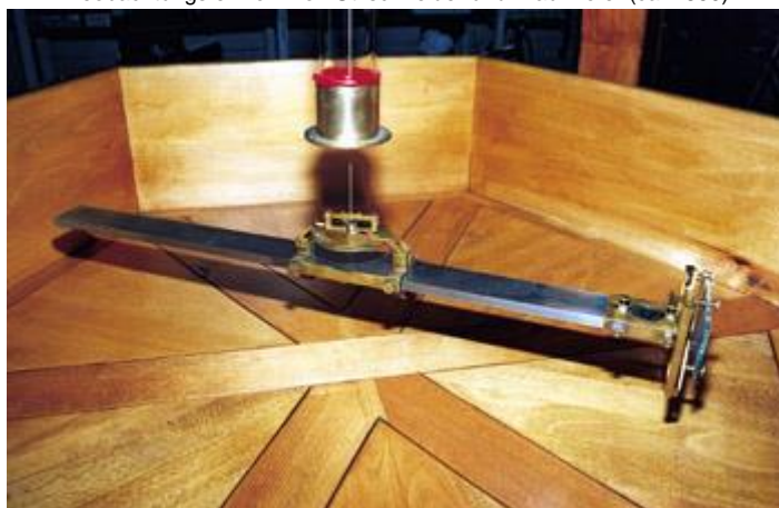
Nachbau des Magnetstabs an einer Seidenfadenaufhängung, Träger mit Alihade und Torsionskreis, Spiegelhalterung und Spiege