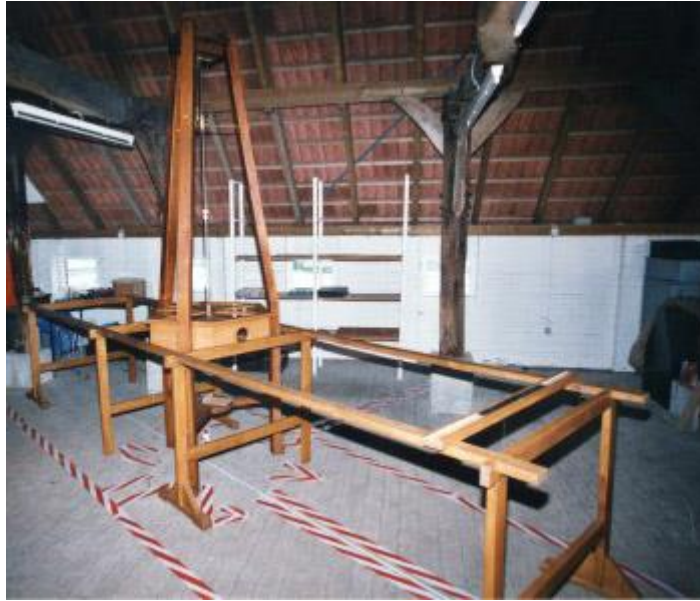
Nachbau des Unifilar-Magnetometers von M. Meyerstein zur Bestimmung der Intensität der erdmagnetischen Kraft in absoluten Maßeinheiten, nach C.F. Gauß und W. Weber (ca. 1835)