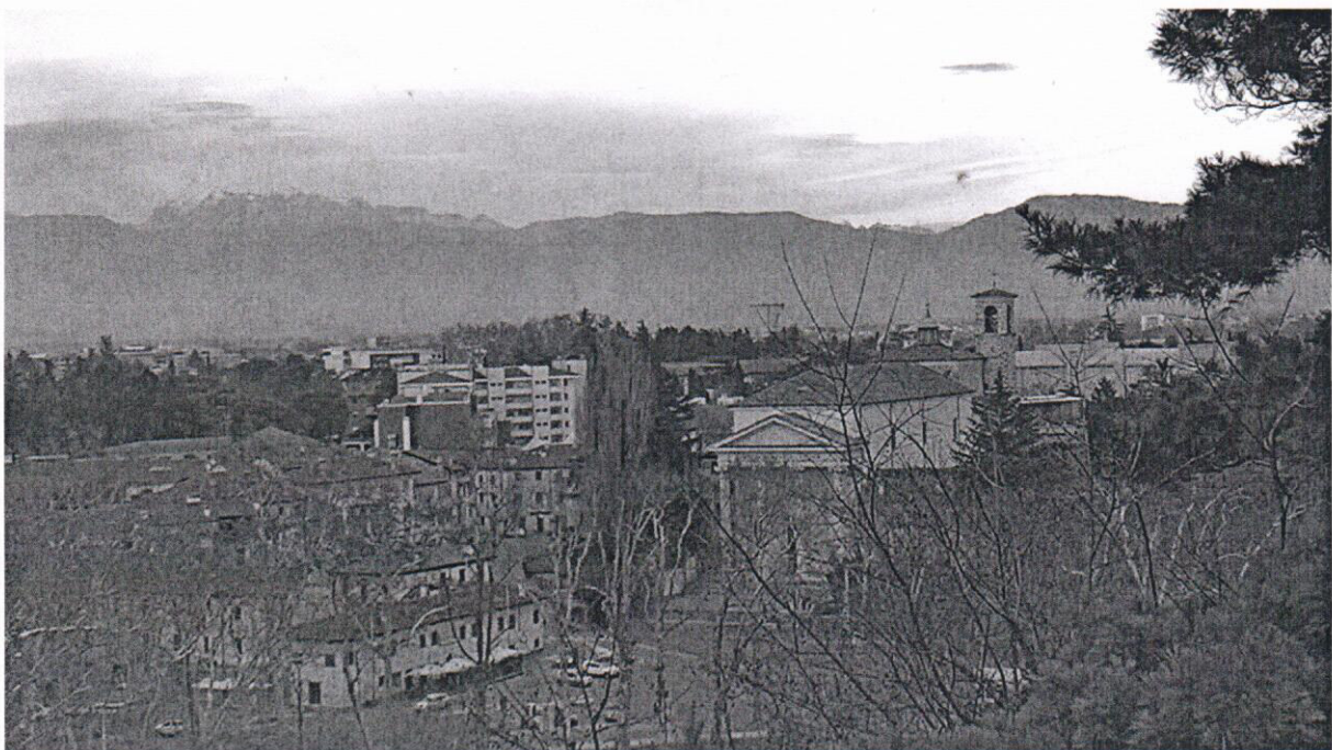
Abbildung 2: Blick vom Castello Richtung Norden