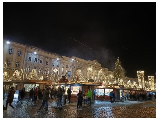
Weihnachtsmarkt in Linz 1