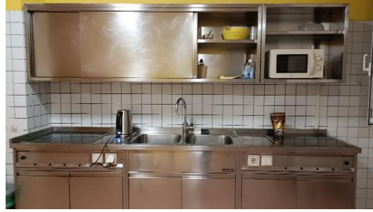
Gemeinschaftsküche im Wohnheim 1