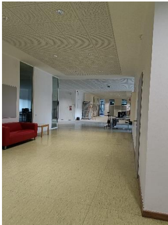
In der PHÖÖ 1