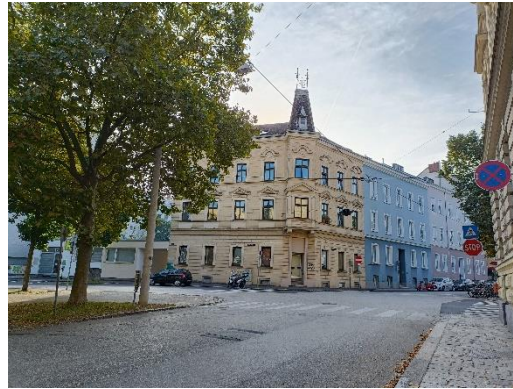
Weg zur PHÖÖ 1