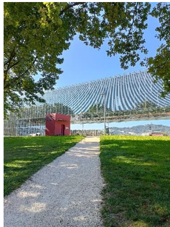
Spaziergang an der Donau 1