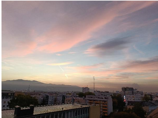
Ausblick aus meinen Zimmer 1