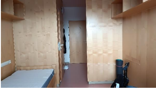
Zimmer bei Ankunft 1