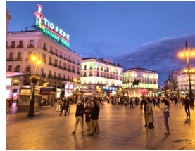
Puerta del Sol