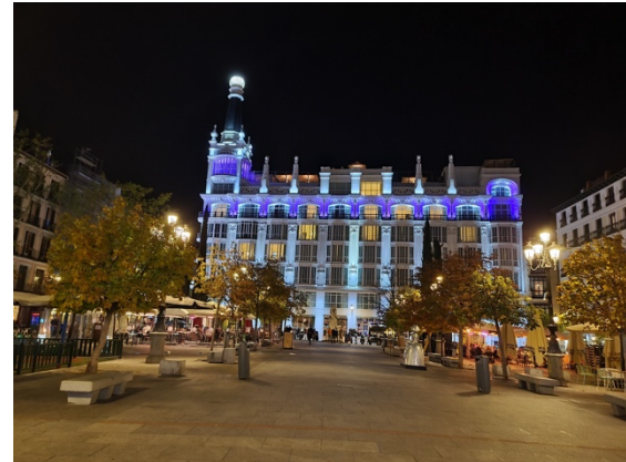
Plaza de Santa Ana