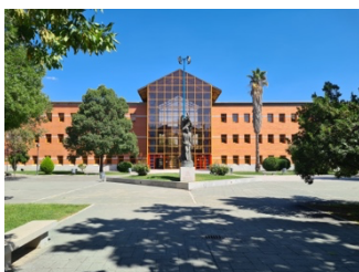
Universitätsgelände der URJC