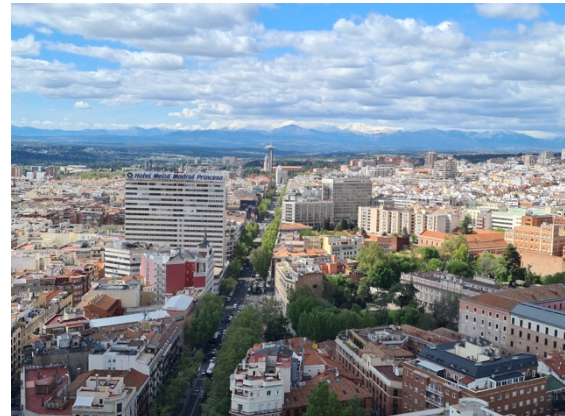
Blick auf die Skyline und die Sierra de Guadarrama