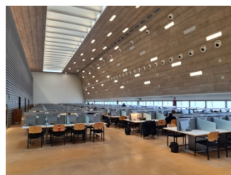
Bibliothek der URJC