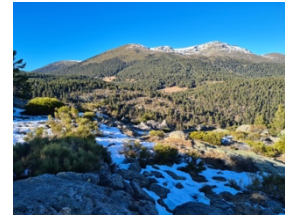
Sierra de Guadarrama