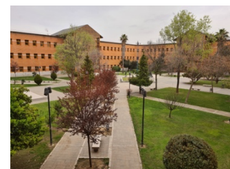
URJC in Vicálvaro