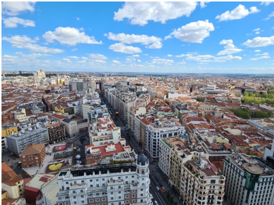
Blick auf die Gran Vía vom Hotel RIU Plaza España

Ich bin sehr froh, dass ich die Möglichkeit bekommen habe, in Madrid studieren und leben zu können. Sowohl mit der Entscheidung für Madrid als auch mit der Entscheidung für einen zweisemestrigen Aufenthalt bin ich sehr zufrieden. Ich hätte ein Semester als zu kurz empfunden, um wirklich anzukommen. Insofern kann ich ein Auslandsjahr in Madrid sehr empfehlen, auch wenn die Lehre an der URJC teilweise sehr unorganisiert ist. Für mich waren es unvergessliche neun Monate, mit vielen Erlebnissen und Abenteuern. Ich habe mich schnell eingelebt und direkt wohlgefühlt. Auch persönlich habe ich viel mitgenommen und aus vielen neuen Situationen lernen können. Somit ist mir der Abschied nicht leichtgefallen, und ich werde mich immer gerne an diese schöne Zeit zurückerinnern.