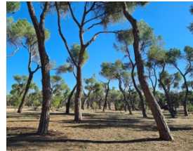
Casa de Campo