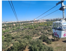
Teleférico (Casa de Campo)