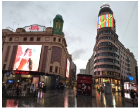
Plaza del Callao