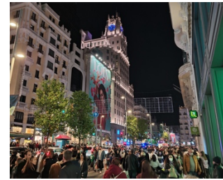
Gran Vía und Edificio Telefónica

Ich studiere im Bachelor Wirtschaftswissenschaften und habe mich für ein Auslandsjahr im 5. und 6. Semester entschieden (Winter- und Sommersemester 2021/22). Beworben habe ich mich Anfang Februar 2021. Dabei habe ich neben Madrid vier weitere Alternativen angegeben, wobei Madrid aber meine erste Wahl war. Grund für meine Entscheidung war, dass ich meine bisherigen Sprachkenntnisse in Spanisch verbessern wollte, mein allgemeines Interesse an der spanischen Kultur und Geschichte und nicht zuletzt das tolle Wetter. Außerdem wollte ich schon immer in einer Weltstadt wohnen. Die Bewerbung und Nominierung empfand ich als unkompliziert. Für jegliche Fragen stand Frau Groscurth zur Verfügung. Vor der Bewerbung habe ich außerdem an einer Infoveranstaltung teilgenommen, die mich in meinem Vorhaben bestärkt hat und sehr hilfreich war. Von der Oldenburger Seite wurde ich Mitte Februar für den Erasmus Austauschplatz vorgeschlagen. Weil die Nominierungsfrist in Madrid bis zum 31. Mai verlief, habe ich erst Mitte Juni die finale Zusage von der madrilenischen Seite bekommen.