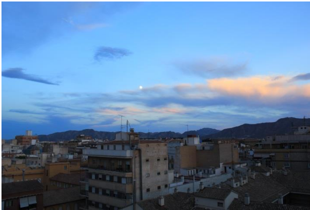
Das schöne Murcia mit den Bergen so nahe. Murcia ist definitiv eine Stadt zum Leben, nicht für Touristen.