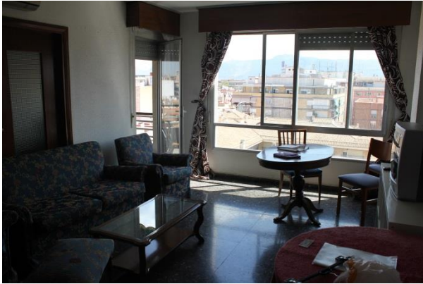
Typische Einrichtung einer Erasmuswohnung