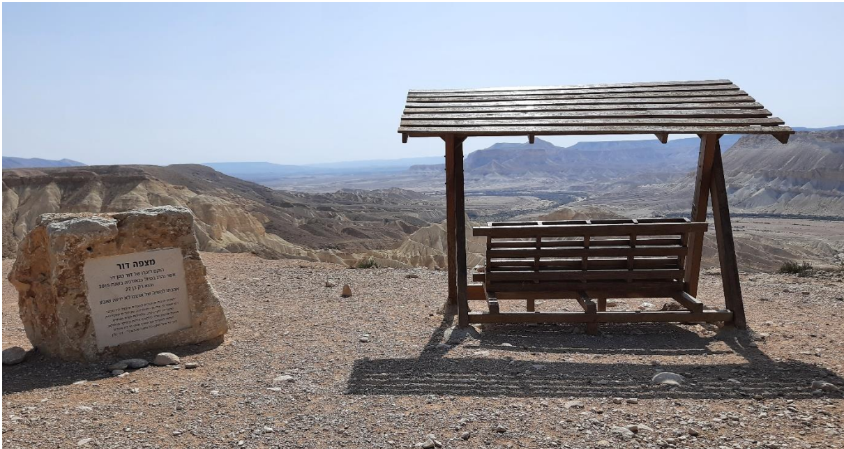
Aussicht auf die Midreshet, 10 Gehminuten vom Campus Sde Boker entfernt

Da ich Umweltmodellierung studiere und ich mich im bisherigen Studium mehr mit marinen Anwendungsfeldern auseinandergesetzt hatte, wollte ich das Auslandssemester nutzen, um ein anderes Ökosystem kennenzulernen – die Wüste! Die BGU hat neben dem Hauptcampus in Beer Sheva einen weiteren Campus in der Midreshet/Sde Boker, welcher 50 km südlich von Beer Sheva entfernt ist mit etwa einer Stunde Busfahrt. Während der Campus Sde Boker klein, aber mitten in der Wüste liegt, spielt sich das Unileben hauptsächlich auf dem gewaltig großen Hauptcampus in Beer Sheva ab.