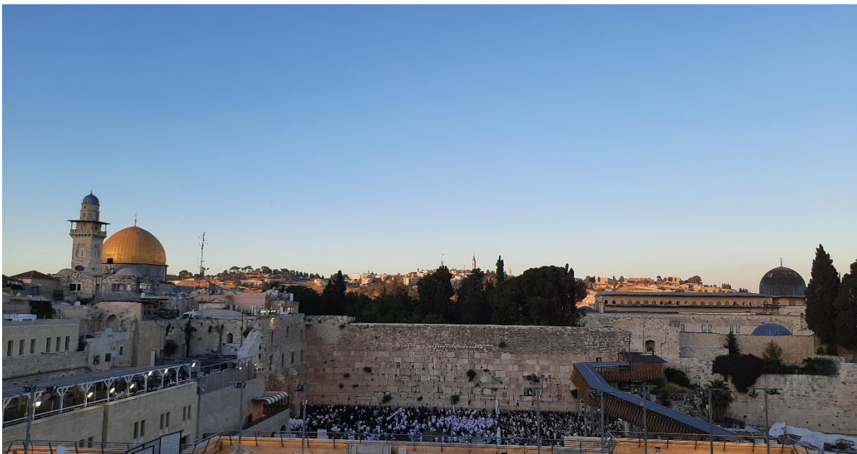
Klagemauer und Al-Aqsa in Jerusalem

Neben privaten Reisen bietet die BGU diverse Freizeitaktivitäten und Ausflüge zu vielen Orten an. Ihr könnt z.B. beim International Office euch Campingausrüstung ausleihen – nutzt dieses Angebot (ein Tipp: nicht in den Sommermonaten campen, die Hitze draußen ist unerträglich...).