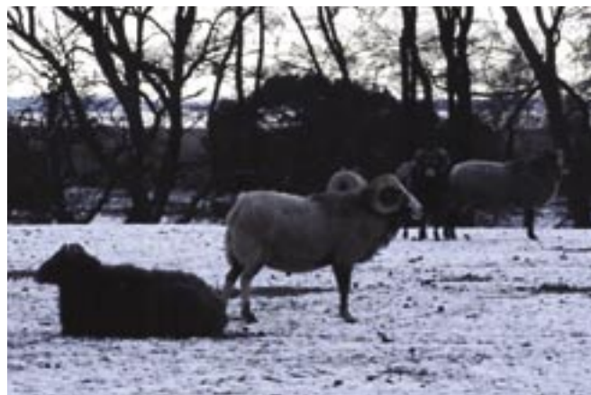
Beweidung an der Müritz: Die Frage ist, mit welcher Beweidungsintensität die Verbuschung verhindert werden kann, andererseits die beweidungsempfindlichen Pflanzen vor dem Aussterben geschützt werden können.

sierten Weltmodells, welches als Modellbausteine „state-of-the-art“-Modelle der grundlegenden Subsysteme Biosphäre, Klima und Ökonomie vereint. Die angesprochenen Forschungsfragen betreffen einen Themenbereich, der in Wissenschaft und Öffentlichkeit derzeit hohe Aktualität besitzt und in Zukunft voraussichtlich von noch höherer Bedeutung sein wird.