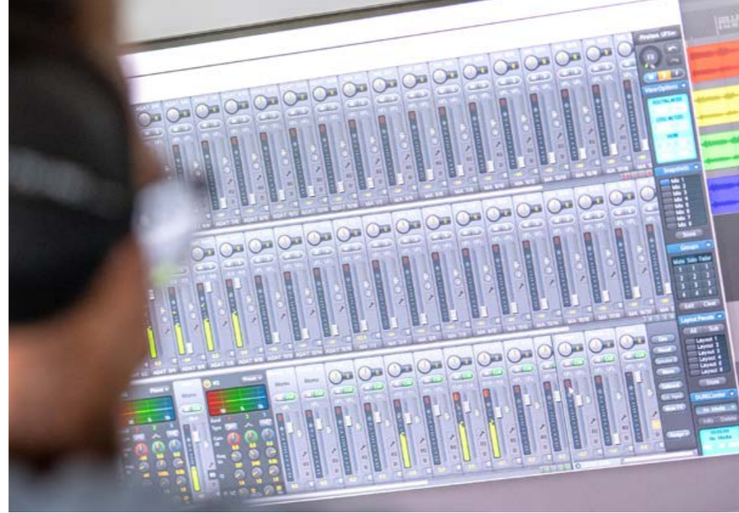
Ein Musikstück ist aus vielen Komponenten zusammengesetzt. Die Fähigkeit, sie alle wahrzunehmen, schwindet mit dem Hörvermögen.