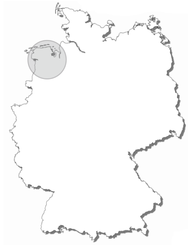
Collection area in Germany