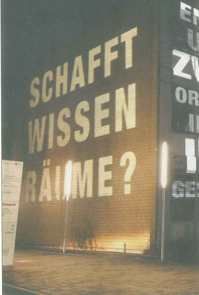
Auf dem Lifelong Learning Campus, hier illuminiert, können die Studierenden einen Bezug zur Universität bilden.

CRL Das Center für lebenslanges Lernen bietet aktuelle und professionelle Weiterbildung