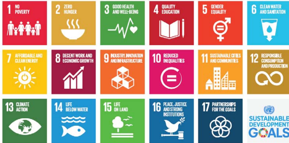
Abbildung 2: Sustainable Development Goals, Quelle: United Nations, 2015