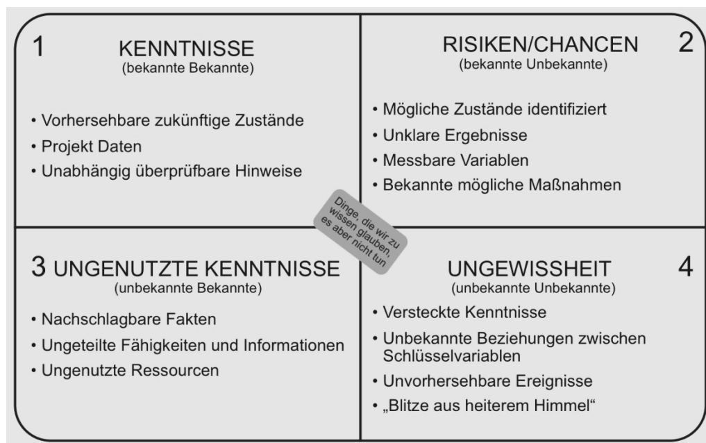
Abb. 1.2: Das Vier-Quadranten-Modell: Alles, was wir über ein Projekt wissen und nicht wissen, findet sich in einem der Quadranten dieses Modells wieder (Cleden 2009, S. 13)

Unter Berücksichtigung der Ausführungen zum wissensbasierten Modell von Unsicherheit im vorangegangenen Abschnitt kann man ein Vier-Quadranten-Modell kreieren, in dem unterschiedliche Dimensionen von Unsicherheit auf Basis von zwei Wissenszuständen („bekannt“/„unbekannt“) abgebildet sind: