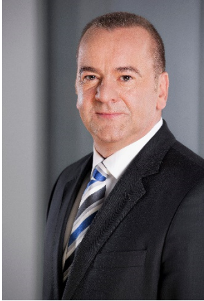
Boris Pistorius Niedersächsischer Minister für Inneres und Sport

„Gegen jede Form von Korruption treten wir entschieden auf. Korruption soll keine Chance haben. Sprechen Sie Fragen der Korruption und ihrer Prävention immer offen an. Informieren und schützen Sie sich.“