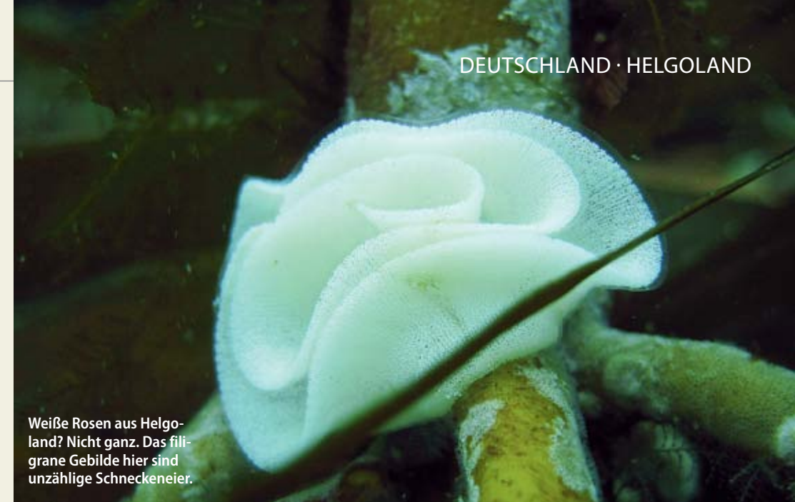
Weißer Rosen aus Helgoland? Nicht ganz. Das filigrane Gebilde hier sind unzählige Schneckeneier.

Ab diesem Moment ist klar: Nicht nur die Robben wollen mit uns spielen. Wir wollen auch mit ihnen spielen. So schmeißen wir uns in unsere Schnorchelausrüstung und machen uns selbständig auf die Suche nach einer Konfrontation auf der Düne. Es dauert auch nicht lange, bis wir von neugierigen Robben umringt sind. Wir beobachten einzelne Schwimmer, um die sich mehrere Rob- ➤