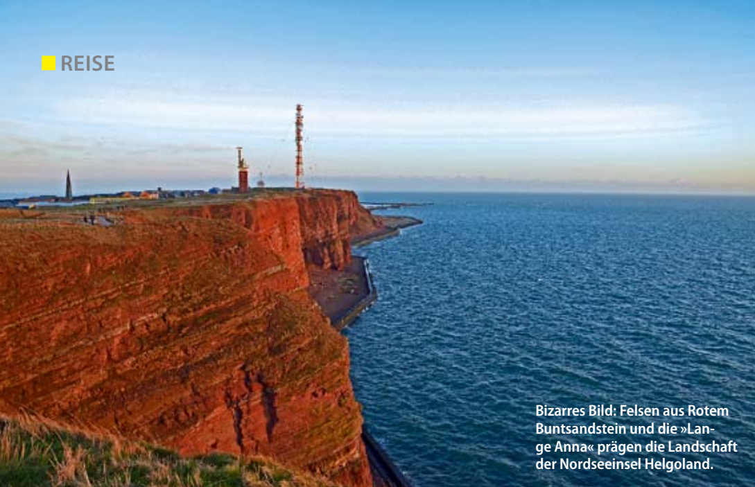
Bizarres Bild: Felsen aus Rotem Buntsandstein und die »Lange Anna« prägen die Landschaft der Nordseeinsel Helgoland.