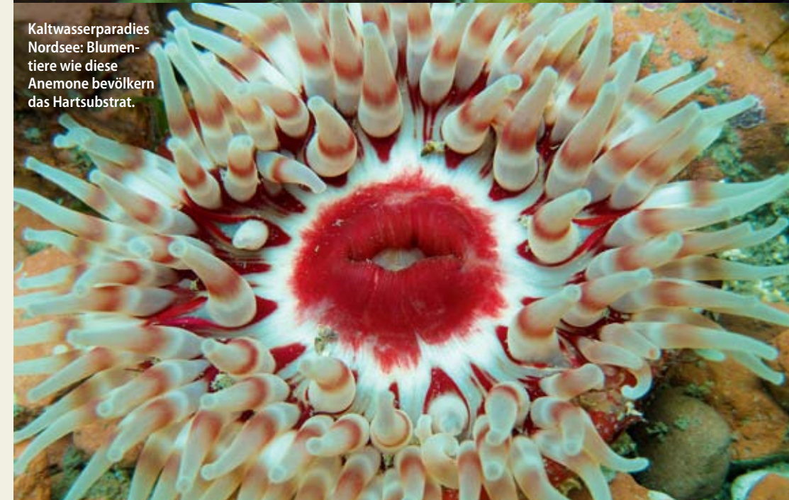
Kaltwasserparadies Nordsee: Blumentiere wie diese Anemone bevölkern das Hartsubstrat.