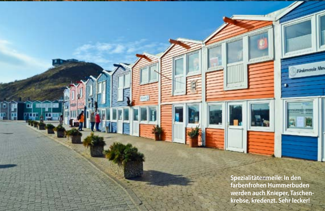
Spezialitätenmeile: In den farbenfrohen Hummerbuden werden auch Knieper, Taschenkrebse, Kredenzt. Sehr lecker!