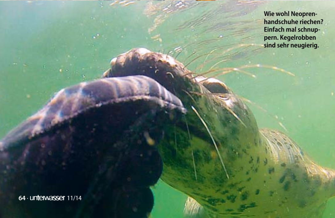
Wie wohl Neoprenhandschuhe riechen? Einfach mal schnuppern. Kegelrobber sind sehr neugierig.

benköpfe ringen. Noch bleiben sie auf Abstand, doch man ist nie allein. Während wir warten, sammeln wir ein paar Fossilien, suchen Donnerkeile und Ammoniten am Meeresgrund, ärgern Strandkrabben und Knieper, die herausfordernd ihre Scheren schwingen.