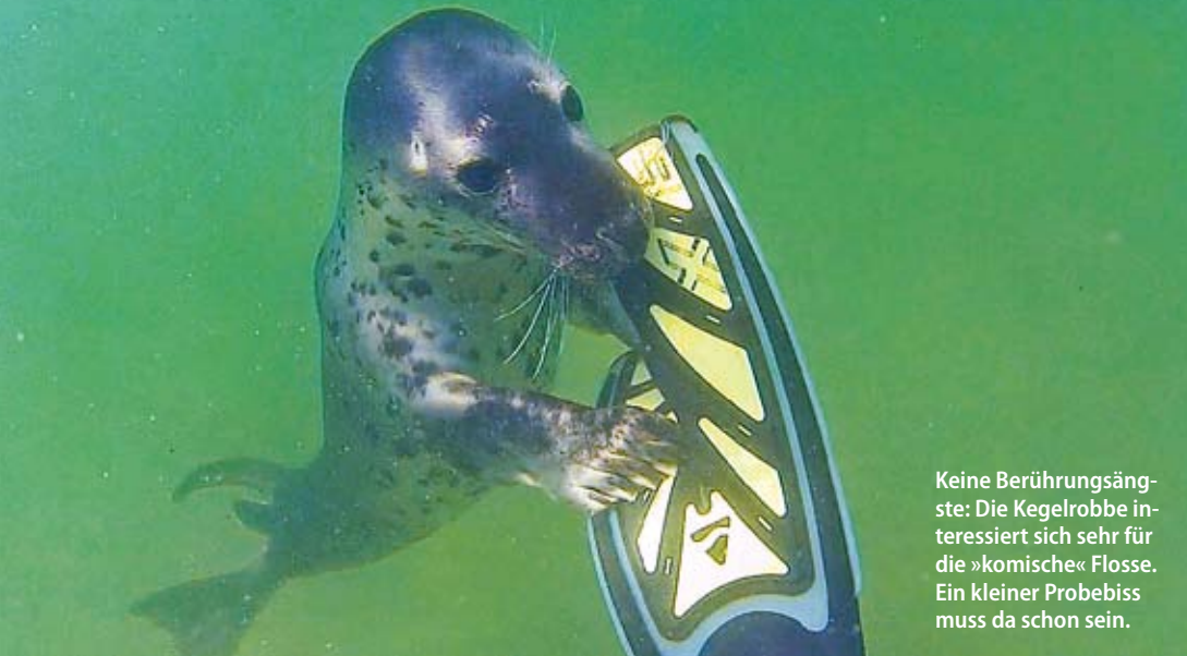
Keine Berührungspunkte: Die Kegelrobbe interessiert sich sehr für die »komische« Flosse. Ein kleiner Probess muss da schon sein.