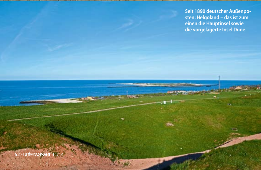
Seit 1890 deutscher Außenposten: Helgoland – das ist zum einen die Hauptinsel sowie die vorgelagerte Insel Düne.

Es ist früher Mittag, als die Fähre uns und unsere gefühlten hundert Gepäckstücke auf dem »Roten Felsen« entlässt, der sich mitten im Nirgendwo aus dem Meer erhebt. Tagestouristen schwanken schon leicht angetrunken an uns vorbei und taumeln in den nächsten Duty-Free-Laden. Andere hetzen, die Kamera, das iPad oder das Handy erhoben, an den Hummerbuden vorbei, um ja alles in den drei Stunden Aufenthalt zu dokumentieren. Doch wir haben Zeit, sagen wir uns immer wieder, und versuchen, uns mit unserem Berg an Gepäck nicht von der Eile der anderen mitreißen zu lassen. Die kommenden drei Monate werden wir genug Zeit für alles hier auf Helgoland haben.