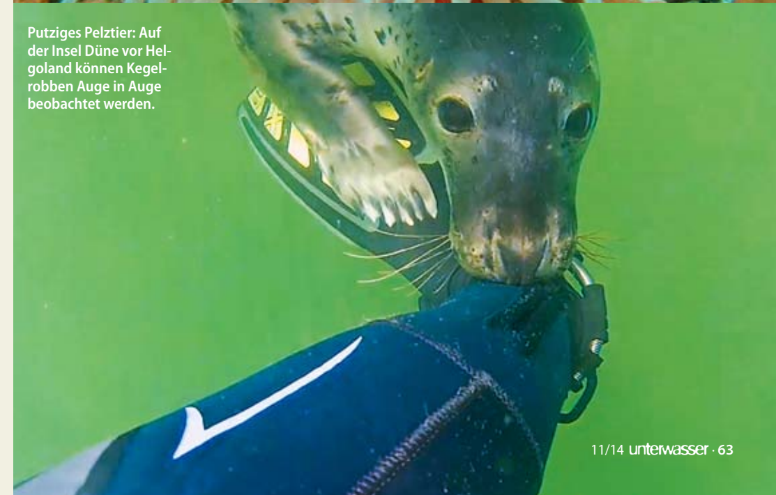
Putziges Pelztier: Auf der Insel Düne vor Helgoland können Kegelrobben Auge in Auge beobachtet werden.