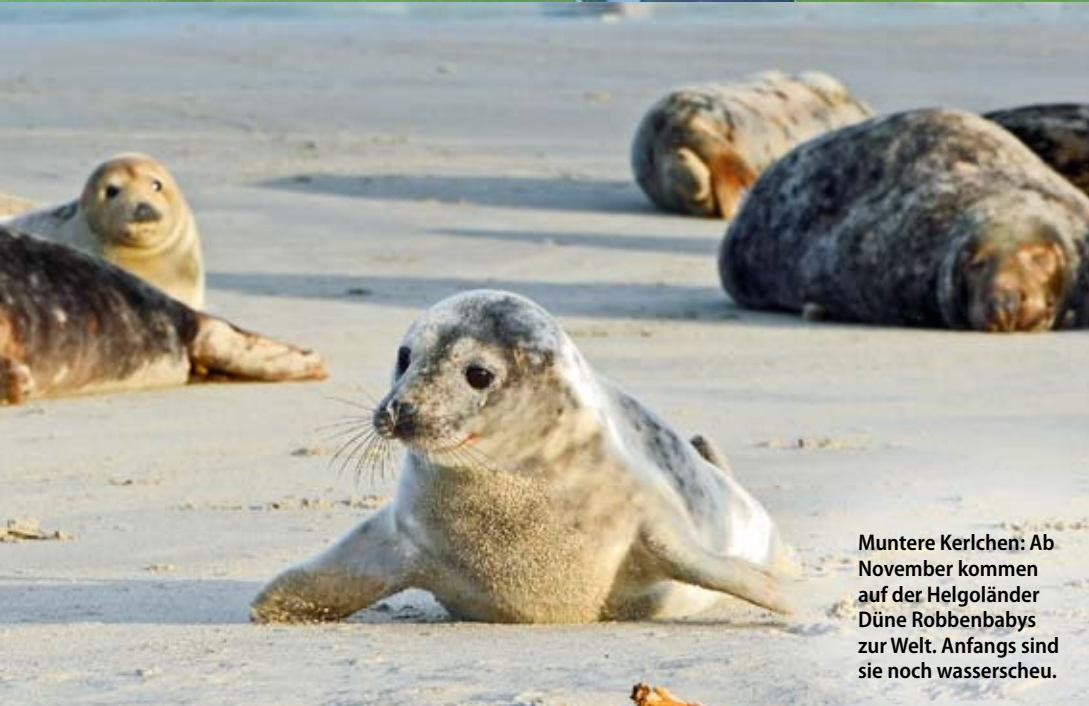
Muntere Kerlchen: Ab November kommen auf der Helgoländer Düne Robbenbabys zur Welt. Anfangs sind sie noch wasserscheu.