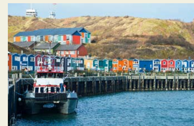
Ein Hoch im Norden: Selbst in der kalten Jahreszeit herrscht auf der Insel Helgoland dank des Golfstroms das mildeste Klima Deutschlands.

► Weitere Infos: Auf der Website www.helgoland.de findet man Unterkunfts- und Gastronomie-tipps in allen Kategorien sowie viel Wissenswertes zu »Deät Lun«.