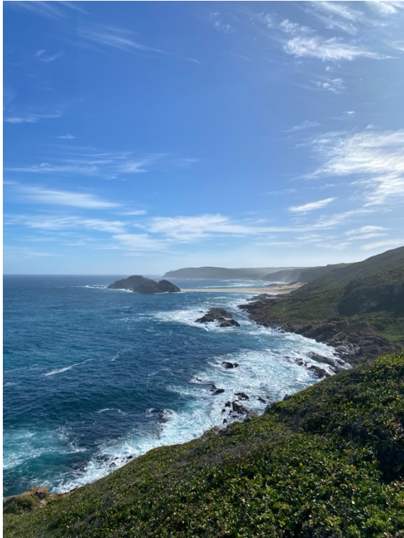
Abbildung 7: Robberg Island