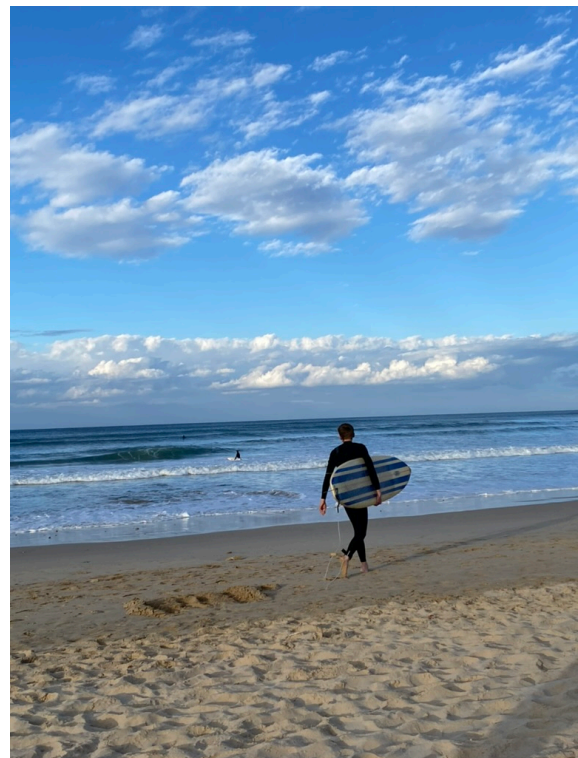
Abbildung 2: Surfen am Pipe Beach