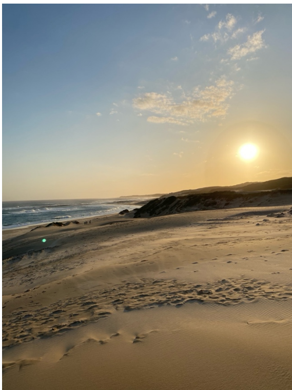
Abbildung 5: Sonnenuntergang in Sardinia Bay