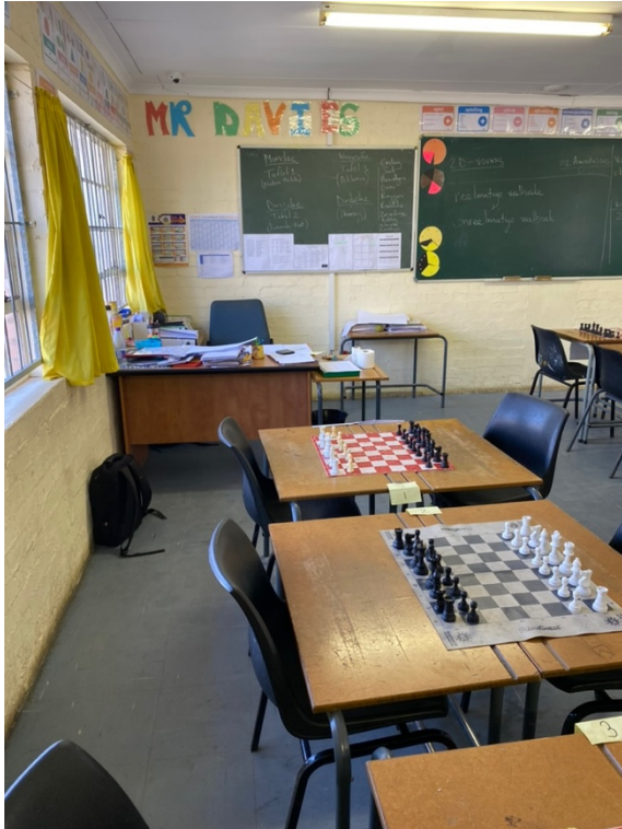
Abbildung 3: Klassenzimmer im MCC