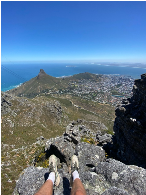
Abbildung 9: Blick auf Kapstadt vom Tafelberg aus