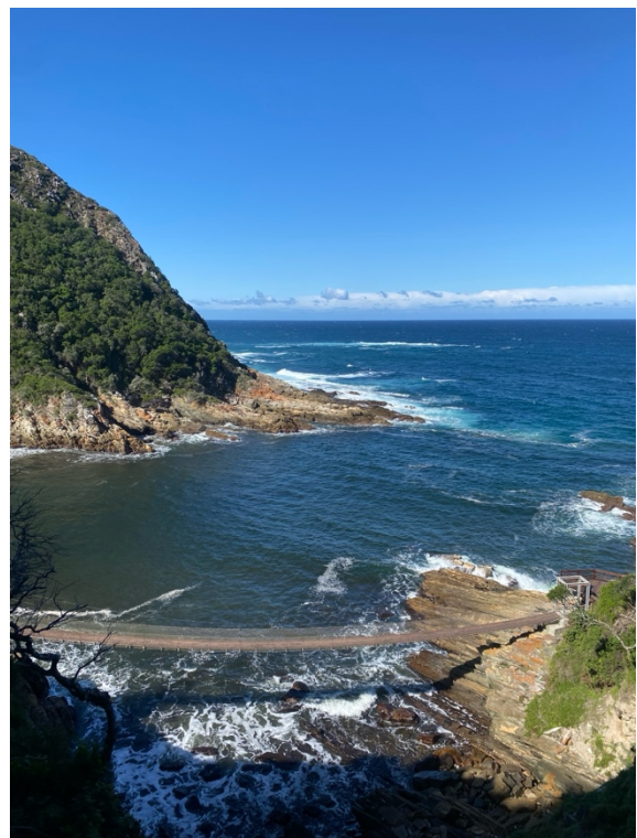
Abbildung 6: Hängebrücke im Tsitsikamma NP