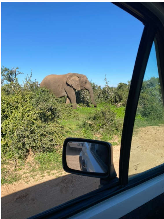
Abbildung 1: Elefant in Addo National Park