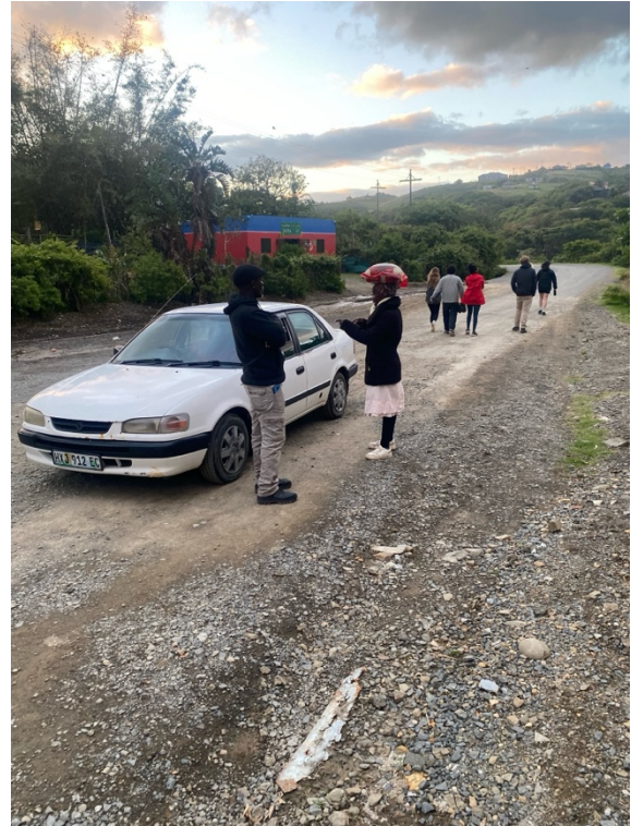
Abbildung 8: Coffee Bay