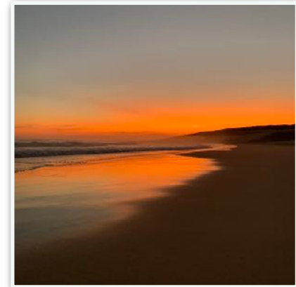
Sunset Sardinia Bay