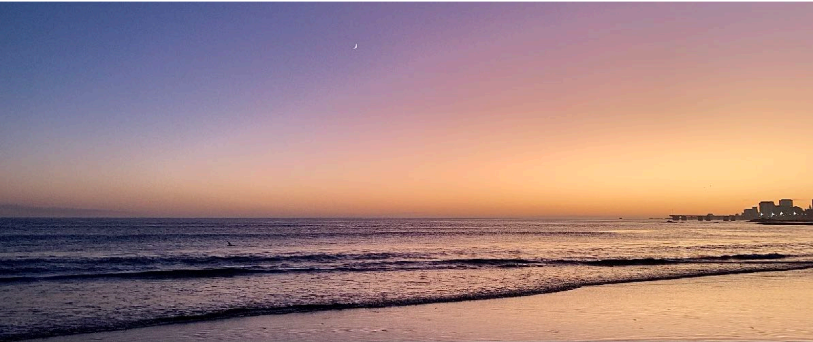
Sonnenaufgang Kings Beach

Gqeberha (Port Elizabeth), Südafrika im WiSe 2022