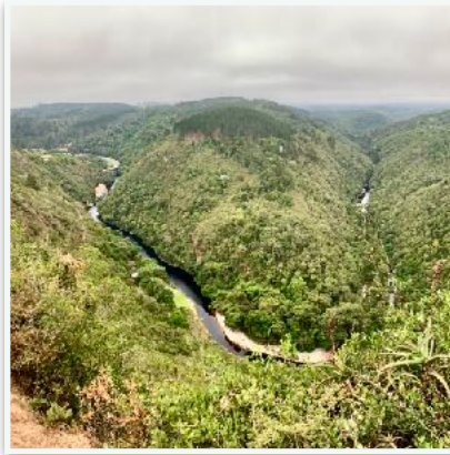
Map of Africa in Wilderness