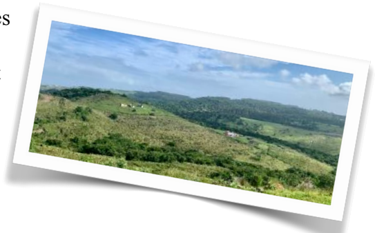
Ich hab's südafrikanische Hobbiton gefunden!