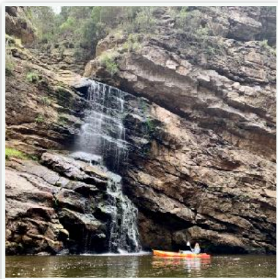
Kayaking Garden Route