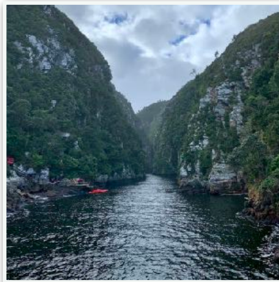
Tsitsikamma Storms River Mouth