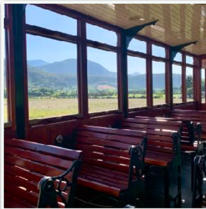
Winery Tram Franshoek