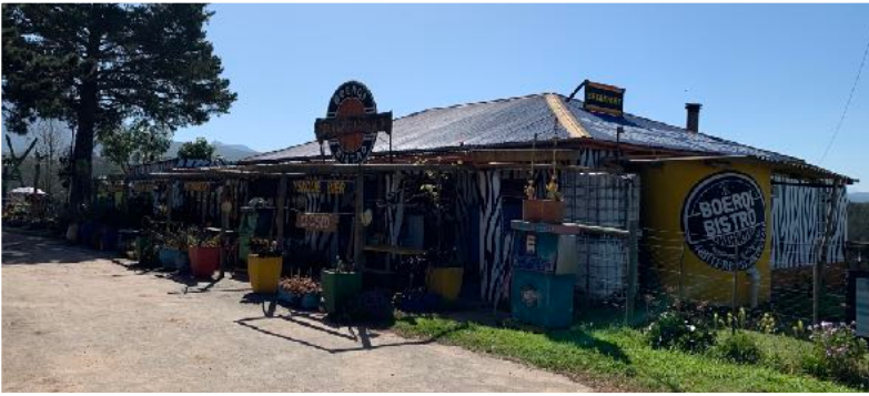
bei Mossel Bay