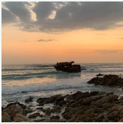
Shipwreck in Struisbaai