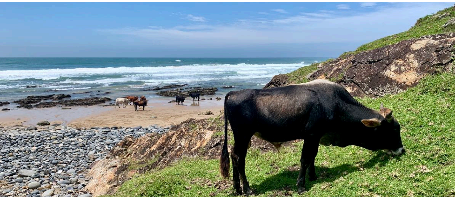
Kühe am Strand in Coffee Bay