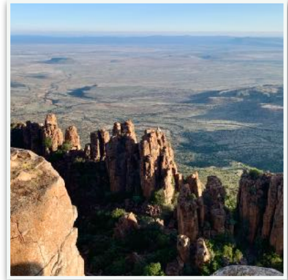
Valley of Desolation in Graaff-Reinet