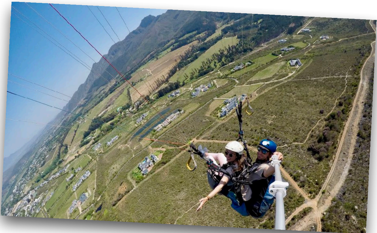
Paragliding in Franshoek