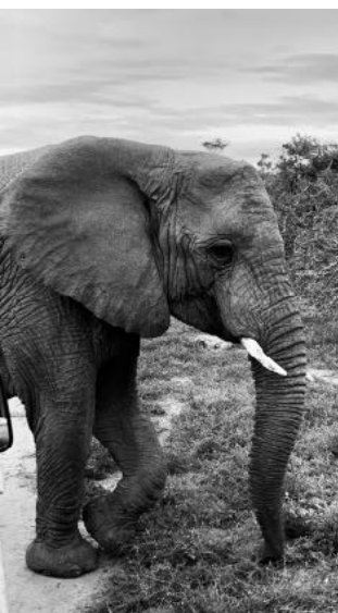
Addo Elephant Park

Einen anderen großen Teil meiner Freizeit habe ich mit Reisen verbracht. Ich habe mir mit ein paar Freundinnen ein Auto geliehen und sind damit größere Routen gefahren, wie die Garden Route, eine Woche Kapstadt, oder die Wild Coast. Auch für Tagesausflüge war das Auto nützlich. Ein Auto ist die sicherste und oft die einzige Möglichkeit, um sich in Südafrika fortzubewegen. Es gibt vieles zu erkunden, besonders entlang der Küste. Man sollte sich frühzeitig mit den Reiseplanungen beschäftigen, damit man schafft, was man unbedingt sehen möchte und noch coole oder außergewöhnliche Airbnb's bekommen kann. Die Zeit rennt sobald man da ist und man muss sich darauf einstellen, dass man niemals alles sehen kann. Auch direkt vor Ort kann man viel Wandern, National Parks besuchen, Surfen, Kayaking, und so weiter... es ist wunderschön, so weit das Auge reicht. Hier mal zum Überblick, wo wir so unterwegs waren: