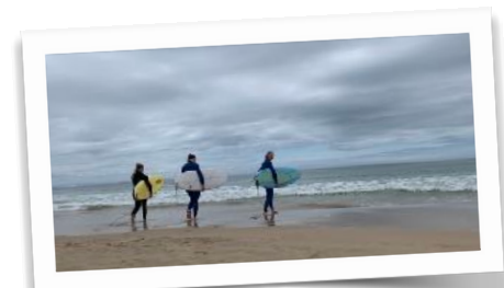
Neue Erlebnisse, neue Begeisterungen