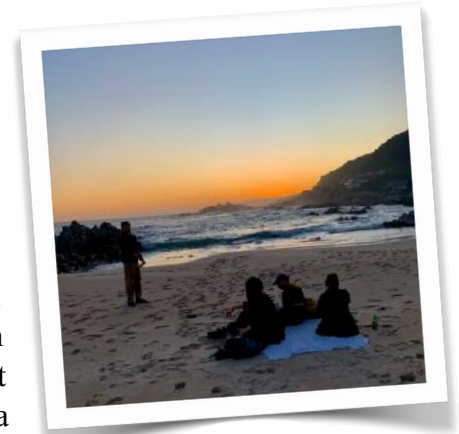
Neue Freundschaften <3