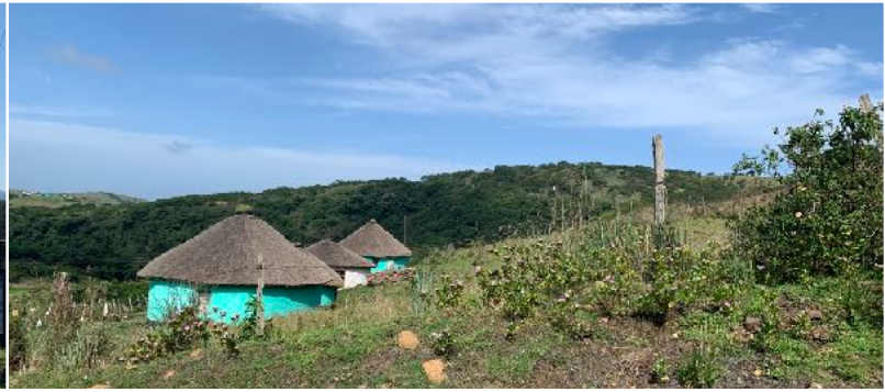
Umtata (Wild Coast)