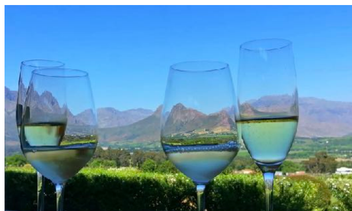
Winery Tour Franshoek