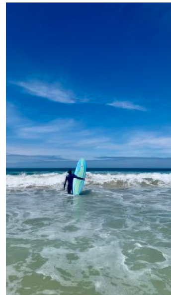
Surfen am Kings Beach

Natürlich gab es kaum etwas, dass unsere Winery-Tour im wunderschönen Franshoek übertreffen konnte, aber auch in Gqeberha gab es ab und zu ein Wine Tasting in der Bridge Street Brewery, auf die wir uns immer gefreut haben. Wie du siehst, findet man auch schnell von selbst heraus, was in Gqeberha und evtl. Umgebung so stattfindet. Einmal im Jahr zum Beispiel findet das Oktoberfest statt, was wir miterleben durften während des Wintersemesters `22. Große Zelte waren aufgebaut mit Band, Essen (sogar Bratwürstchen gab es!) und natürlich einer Menge Bier... Also freu dich auch auf saisonale Ereignisse, die Stadt Gqeberha hat vieles zu bieten!