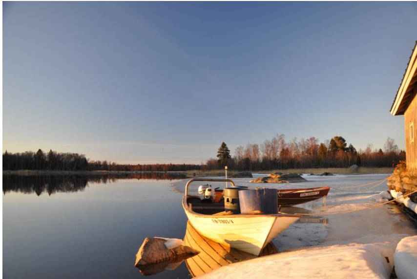
Figure 2 . Frühling im Kvarken Archipelago - einen Ausflug wert.