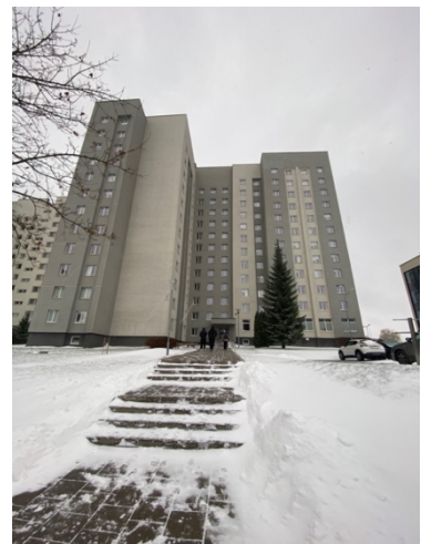
Wohnheim von außen

Kommunikation auf Englisch sehr schwierig. Ich war leider sehr frustriert, da auf vielen Probleme keine Hilfe von offizieller Seite entgegen kam. Ich hatte am Ende auch noch Probleme mit Bettwanzen, was die ganze Sache nochmal komplizierter und unangenehmer gemacht hat. Das Wohnheim ist ungefähr 30-40 Minuten mit dem Bus außerhalb der Stadt gelegen. Mit dem Uber sind es ungefähr 15 Minuten. Das hat mich persönlich etwas gestört, weil ich nicht „mal eben“ in die Stadt konnte um zum Beispiel ein Kaffee zu trinken. Das positive an dem Wohnheim ist allerdings, dass viele andere Erasmus studierende dort sind und man schnell neue Freunde findet (und es hilft auch sich mit denen über das Wohnheim zu sprechen, da alle dieselben Probleme haben). Es gibt auch noch andere Möglichkeiten in Vilnius zu wohnen. Einige Studierende haben sich auch in private Wohnheimen eingemietet. Allerdings beträgt die Miete hier 500 € aufwärts. Es gibt auch die Möglichkeit in der Stadt zu wohnen, aber dort ist Wohnungssuche aus Deutschland und auch Vorort sehr schwer. Die Wohnung sind rar und sehr teuer.