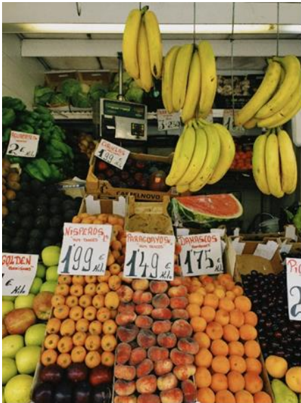
Mercado Central de Cádiz

Cádiz ist zwar eine recht kleine Stadt aber hat super viel zu bieten. Natürlich fand ich die Nähe zum Meer einfach unschlagbar, denn auch wenn man viel zu tun hat kann man nachmittags oder in den Pausen zum Strand. Direkt beim historischen Centrum liegt der Strand La Caleta . Bisschen weiterentfernt liegt der Strand Playa de Santa Maria , den man perfekt mit dem Skateboard erreichen kann, zu Fuß ist er aus dem historischen Zentrum ungefähr 20 min entfernt. In Cádiz kann man auch super surfen. Die Saison neigt sich zwar im Sommer dem Ende zu, jedoch gibt es auch im Sommer immer mal wieder Tage, an denen man gut surfen kann. Cádiz ist voll mit Erasmus Studenten, wodurch immer was los ist. Am Wochenende sind wir immer gerne zum Markt gegangen und haben dort etwas gegessen und getrunken. Danach geht man meist in weitere Bars. Im Sommersemester ist nicht nur Carnaval , in vielen Städten gibt es auch die sogenannten Ferías . Mir hat die Feria de Cabellos in Jerez am besten gefallen. Einem wird auf jeden Fall nicht langweilig in Cádiz!