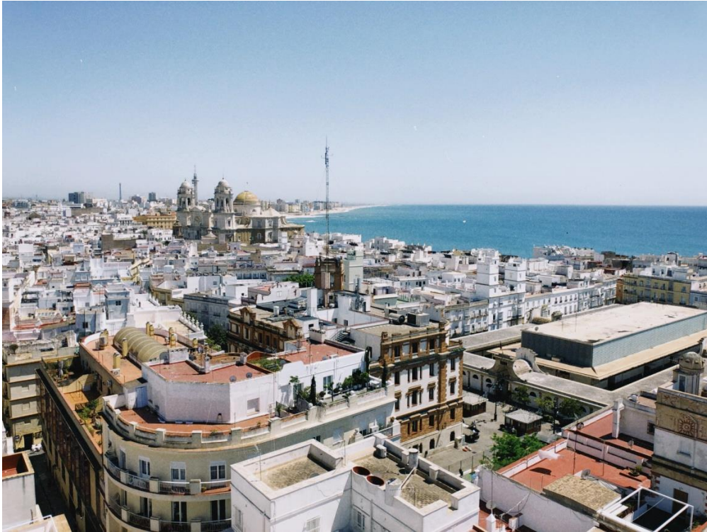
Bild vom Torre Tavira mit Blick auf die Catedral de Cádiz – Centro Histórico