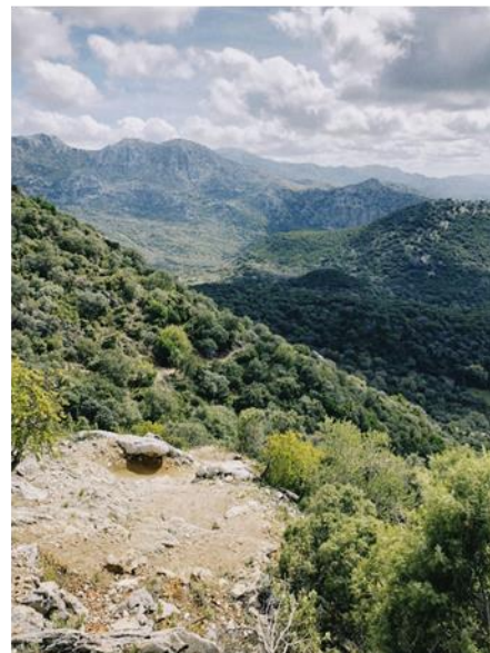
El Torreón – höchster Berg der Provinz Cádiz