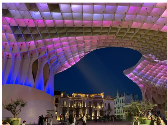
(Las Setas – bei Tag und Nacht)