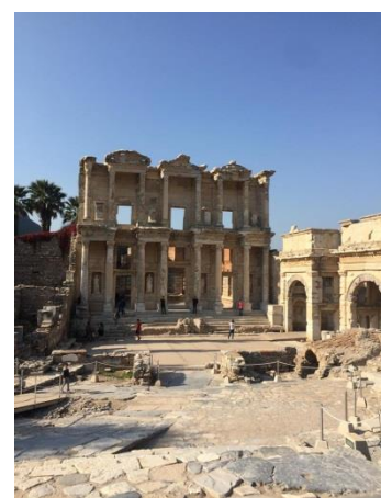
Die Bibliothek von Efes