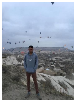
Ich morgens in Kappadokkien