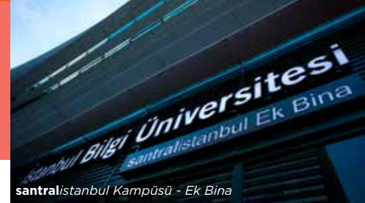
santralistanbul Kampüsü - Ek Bina