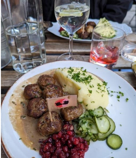
Köttbullar @Meat- balls for the People