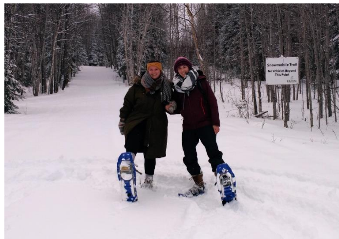
Snowshoeing im Prince Albert National Park / Saskatchewan