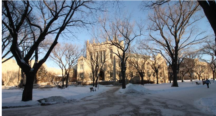
der Campus der University of Saskatchewan

Als Visiting Student beliefen sich meine Studiengebühren für die drei Kurse auf 5300 $. Obwohl ich den Betrag vom Amt für Ausbildungsförderung zurückerstattet bekam, musste ich die Kosten vorschießen. Zusätzlich zum Auslandsbafög bewarb ich mich auf ein PROMOS-Stipendium bzw. den Fernwehzuschuss. Ich erhielt die Zusage für den Fernwehzuschuss in Höhe von 2000 € im März 2017. Diese beiden Finanzierungsquellen gemeinsam mit meinen Ersparnissen waren wesentlich, um mein Auslandssemester absolvieren zu können.