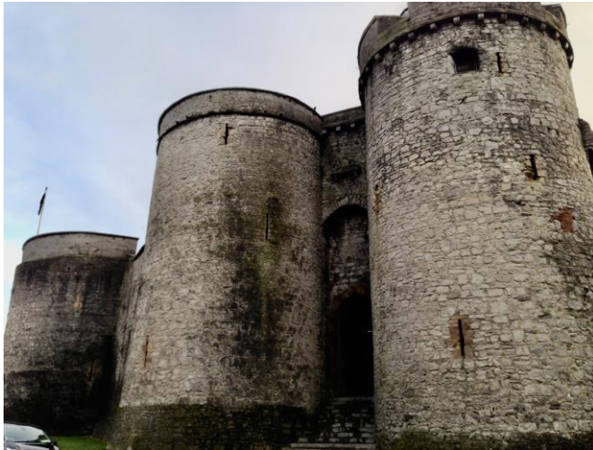
King John Castle (Limerick Centre City)

Campus herum zu gehen. Der Unicampus ist sehr groß und hat viele schöne Ecken und es bringt viel Spaß, diese zu entdecken.