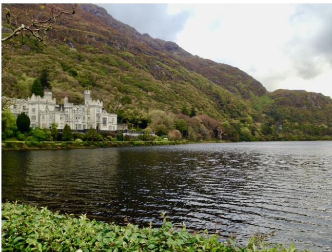
Kyllemore Abbey (Connemara)

Das Studium an der UL ist eine unvergessliche und spannende Erfahrung. Die vier Monate vergehen extrem schnell, deshalb ist die Planung und die Einhaltung der Fristen besonders wichtig. Da es manchmal schwer ist, sich an einer neuen Uni zu orientieren, würde ich das Buddy-Programm empfehlen. Die Anmeldung erfolgt online ca. ein Monat nach der Zusage von der Uni. Man erhält eine E-Mail mit dem Link zum Anmeldeformular. Einem Buddy zugeordnet zu werden hat mehrere Vorteile. Die Hauptaufgabe von Buddys ist die Studierenden zu unterstützen und mit dem Unileben vertraut zu machen. Darüber hinaus können die Buddys Eintrittskarten (z.B. für Kinoabende) umsonst besorgen. Für diejenigen, die sich für Irische Kultur und Sprache interessieren, gibt es Module, die in der WO vorgestellt werden. Ein weiterer Tipp wäre in den ersten Wochen sich mehr Zeit lassen, um das richtige Gebäude und den richtigen Raum zu finden. Besonders ist das Main Building sehr verwirrend, da seine Teile nacheinander dazu gebaut wurden. Die Hauptempfehlung wäre, möglichst viele Angebote der Uni und der Bibliothek zu nutzen. Und nicht vergessen, das Studium ist nicht das einzige im Leben, deshalb lohnt es sich sehr, ein Mitglied von Vereinen zu werden und das schöne Land zu sehen.