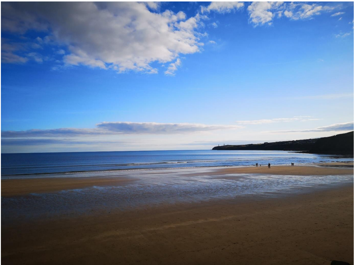
Tramore. 30 Minuten von Waterford entfernt.