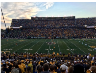
War Memorial Stadium