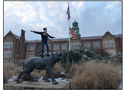
Towson University (Towson Tiger!)

Schon seit langem hatte ich den Traum einmal in die USA zu reisen und das Land und das Leben in Amerika kennenlernen zu können. Diese Erfahrung in mein Studium einzubetten erschien mir als die ideale Möglichkeit, weshalb ich mich im Herbst 2016 auf einen Direktaustauschplatz beworben habe. Für die Bewerbung musste ich vorher einen DAAD-Sprachtest für 20€ absolvieren, wegen dessen man sich aber keine Sorgen machen muss. Aufgrund des Kursangebotes und der Lage habe ich die Towson University in Maryland als meine Erstwahl angegeben. Erhielt ich zunächst nur eine Zusage für meine Zweitwahl, konnte ich glücklicherweise später doch noch den zweiten Direktaustauschplatz an der Towson University ergattern.