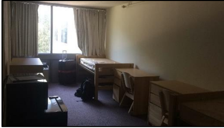
Teil des uneingerichteten Zimmers