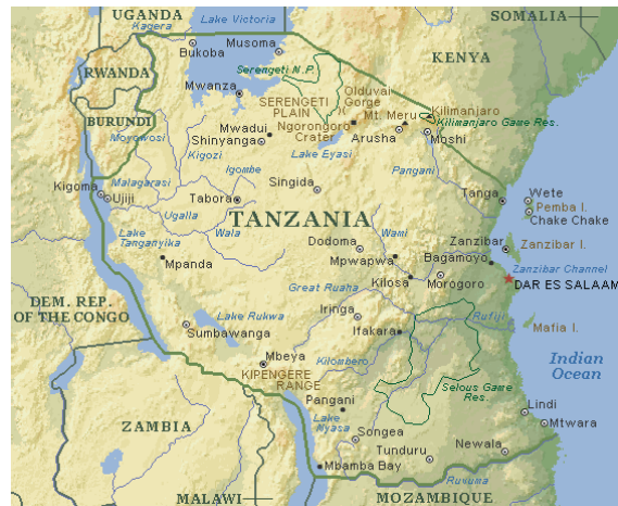
Abbildung 1: Tansania im Afrikanischen- und Ostafrikanischen Kontext (Quellen 1 und 2)

Die Landesfläche entspricht der 2,5fachen Fläche Deutschlands, die Einwohnerzahl jedoch nur knapp der Hälfte (soweit nicht anders erwähnt, beziehen sich alle Angaben dieses Abschnittes auf Quelle 3). Es gibt um die 130 verschiedene Ethnien und Sprachen, wobei Kiswahili als Zweitsprache von nahezu jedem gesprochen wird.