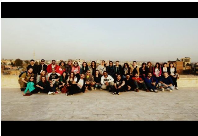
Gruppenfoto der Erasmusstudenten bei einem gemeinsamen Ausflug nach Mardin