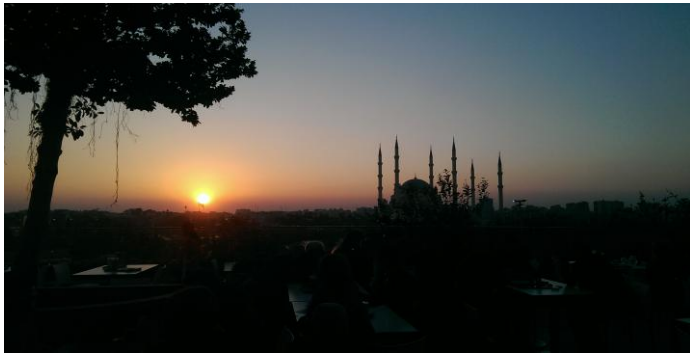
Sonnenuntergang auf der Terrasse des Optimums, des größten Einkaufszentrums in der Stadt

Wenn ihr auch überlegt ein Semester in Adana zu studieren oder noch Fragen habt, schreibt mir gerne.