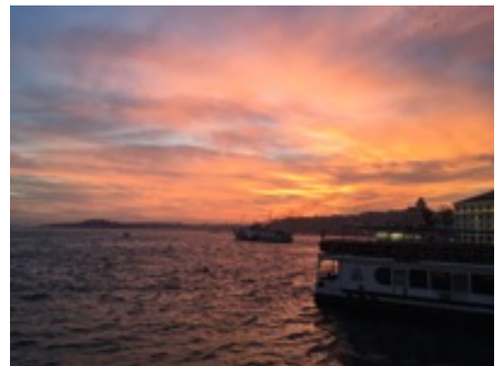
Abfahrt der Fähre in Besiktas

Ein Zimmer fand ich über Airbnb was vielleicht nicht die beste Wahl war, denn das Vermietungs-Business in Istanbul ist auch Opfer der Gentrifizierung und als ausländischer Studierender kann man sich auf überbezahlte Bruchbuden einstellen. Es dient den meisten einfach als guter Nebenverdienst. Ich bin einmal umgezogen, andere mehrmals, aber wieder andere hatten auch großes Glück und haben mit ihren Mitbewohner Freundschaften geschlossen. Als Rat, ein Hostelbett buchen und vor Ort auf die Suche gehen. Zimmer werden von heute auf morgen vergeben, alles kein Problem. Kommt Hektik auf, dann sowieso erstmal einen Çay trinken und in Ruhe abwägen.