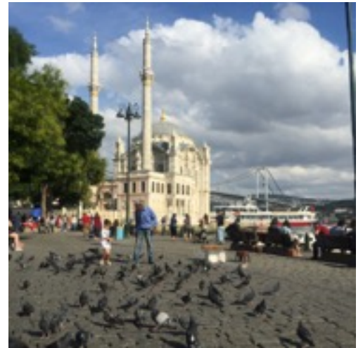
Ortaköy Moschee von außen