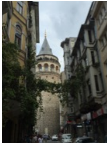
Galata Turm - Beyoğlu