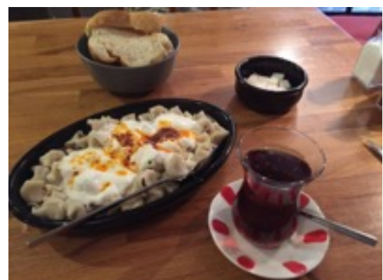
Typisch türkische Manti und Çay