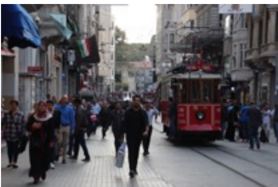
Istiklal Caddesi - Taksim

Voller Tatendrang habe ich mich also am ersten offiziellen Uni-Tag Richtig Ayazağa aufgemacht und bin ins Verkehrschaos von Istanbul getaucht. Das ist so eine Sache für sich. Als Dorfkind und Wahl-Oldenburgerin liebe ich Platz. Und Stille. Und Fahrräder. Und so einiges mehr, das Istanbul dir sofort raubt. Aber das macht nichts, man gewohnt sich (nach anfänglichen kleinen