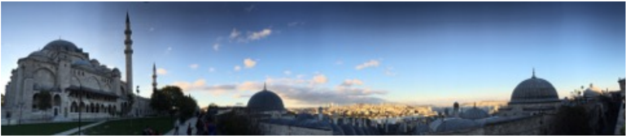
Süleymaniye Moschee in Fatih