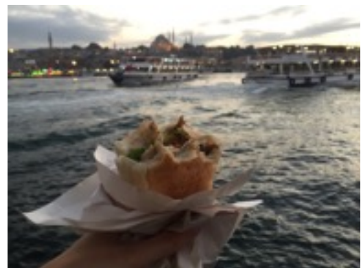
Balık sandviç (Fischbrötchen) an der Galata Brücke

Da man in der Uni also nur rein zufällig andere internationale Studierende trifft, zum Beispiel in Kursen, sollte man unbedingt versuchen andere Leute kennenzulernen. Es gibt einige sehr nette private Ausflüge, organisiert von anderen internationalen Gruppen oder interessierten Türken, an