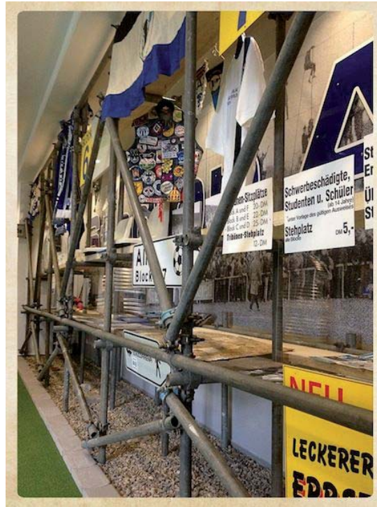
Abb. 2: Inszenierung im MAFA

Selbst die Litfaßsäulen, welche die einzelnen Themen beherbergen, sind auf eine Weise angeordnet, dass sie Spieler auf dem Rasen konnotieren. Mehrere FVM (zum Beispiel Club-Museum, FC Bayern-Erlebniswelt ) machen die scheinbare Präsenz von Spielern noch deutlicher durch Pappfiguren (ehemaliger) Spieler, denen man beim Rundgang begegnet, andere (zum Beispiel Borusseum, Wuseum ) inszenieren Stadionsituationen durch kleine Kinos, in denen man auf den originalen Sitzschalen des Stadions sitzt und Spielszenen betrachtet. Inszenierungen der beschriebenen Art sollen, wie Scholze es sagt, „Besuchern ein weitgehend unmittelbares Nacherleben von Geschichte [...] ermöglichen“ (Scholze, S. 28). Dies könnte als erstes