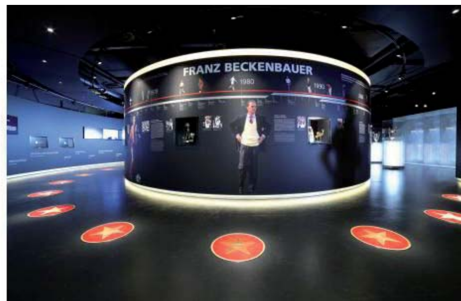
Abb. 3.: Walk of Fame beim FC Bayern

Unabhängig von der nicht endgültig zu klärenden Frage nach der Gratwanderung im Spiel mit Tradition(en), steht die identitätsproduzierende Rolle der FVM außer Frage. Offen ist noch, in welchem Diskurs von Identität sie zu verorten sind. Wie beschrieben, sieht Macdonald den Identitätsbegriff im Wandel. Konnte das Muse-