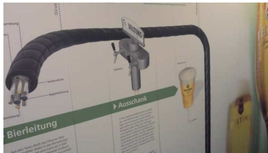
Abb. 6: Schautafel im Schalke-Museum

gezeigt werden. So wird suggeriert, dass die Entwicklung des Fußballs besser nachzuvollziehen sei, wenn man gleichzeitig die technische Entwicklung von Autos verinnerlicht und sich somit einem männlich-konnotierten Interessengebiet annimmt. Eine ähnliche Richtung schlägt auch das Wuseum ein. So zeigt es beispielsweise eine Starkstrommuffe als Objekt, die einst Schuld an einem Stromausfall im Stadion war und beschrifteten Teile von Flutlichtmasten mit technischen Daten als stünden diese in einem Autohaus zum Verkauf. Das Schalke-Museum erläutert auf einer ausführlichen Schautafel, wie das Bier ins Stadion kommt und welche Produktionsprozesse zuvor durchlaufen werden. Auch in diesem Fall wird wohl einem Sponsor Rechnung getragen, nichtsdestotrotz wird der Zusammenhang von Männlichkeit und Technik tradiert und sogar um den Faktor Bier als typisch-männliches Getränk erweitert (Abbildung 6).