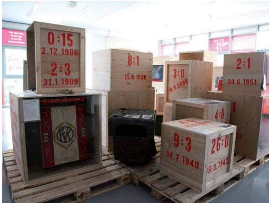
Abb. 7: FCK-Museum im Aufbau

Das methodische Vorgehen dieser Arbeit hat sich weitestgehend als praktikabel erwiesen, die Vermittlungsarbeit von Fußballvereinsmuseen zu analysieren. Nichtsdestotrotz kann ich im Nachhinein einige methodische Schritte hinterfragen, um vergleichbare Arbeiten zu optimieren. Zunächst stuft ich es als alternativlos ein, die Analyse durch ein überwiegend empirisches Vorgehen vollzogen zu haben, da das theoretische Material beinahe nicht existent war. Die zu Beginn des Arbeitsprozesses angedachte Unterteilung in quantitative und qualitative Analyse habe ich bereits früh hinterfragt und so die