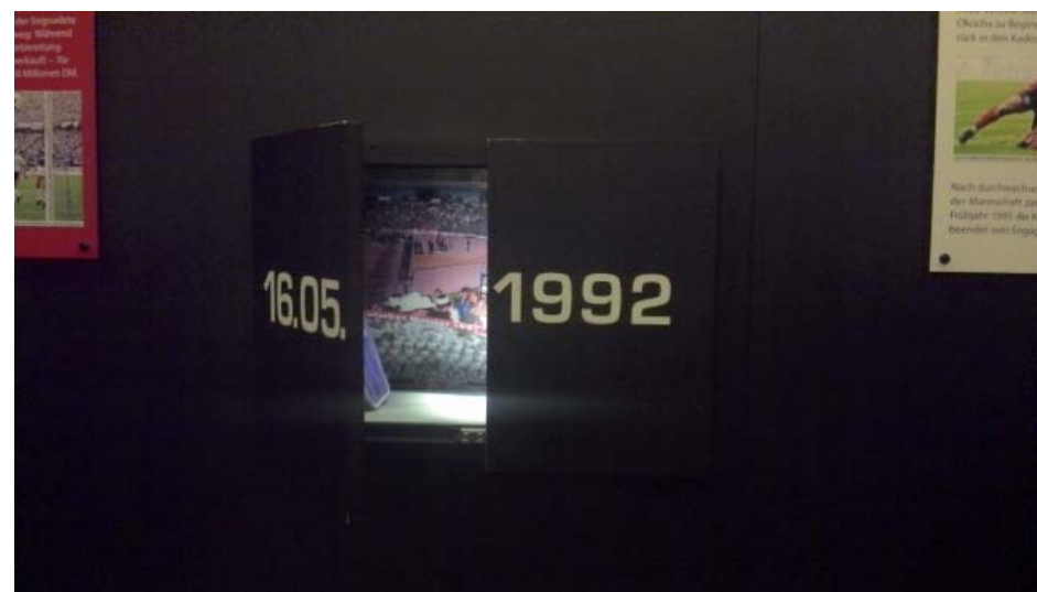
Abb. 5: Vitrine im Eintracht Frankfurt Museum

Betrachtet man die sportlich schweren Zeiten der jeweiligen Vereine, gelingt es einigen der FVM diese mit einer gewissen Portion Humor und Selbstironie darzustellen. So kann die Überhöhung der Bedeutung des Fußballs und des Vereins etwas revidiert werden. Ein Beispiel lässt sich im Eintracht Frankfurt Museum finden, in dem die Überhöhung derart auf die Spitze getrieben wird, dass sie bricht: Während alle anderen Objekte unmittelbar betrachtet werden können, finden sich jene zur Saison 1991/92 hinter einer schwarzen Holztür auf der nur das Datum 16.05.1992 in weißer Schrift steht. An diesem Tag verspielte die Mannschaft der Eintracht am letzten Spieltag der Bundesligasaison überraschend die Meisterschaft – die Besucher_innen sollen selbst entscheiden, ob sie es sich ‚antun‘ und diese Tür öffnen möchten (Abbildung 5).