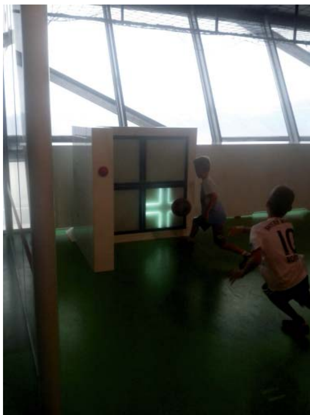
Abb. 4: Spiel beim FC-Bayern

Borusseum beispielsweise klassische Kommentator-Floskeln 33 mit Spielszenen verknüpfen oder verschiedene Taktik-Systeme spielerisch erlernen. In der FC-Bayern Erlebniswelt können Besucher_innen ihre Reaktionsfähigkeiten, ähnlich wie ein Torwart, bei einem Spiel verbessern oder ihre Zielgenauigkeit bei einem anderen Spiel optimieren, indem sie auf einem eigens eingerichteten Spielfeld versuchen, blinkende Ziele mit einem Ball anzuschließen (Abbildung 4).