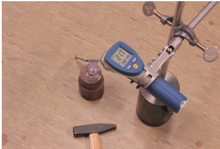
Abb. 2a: Temperatur vor...