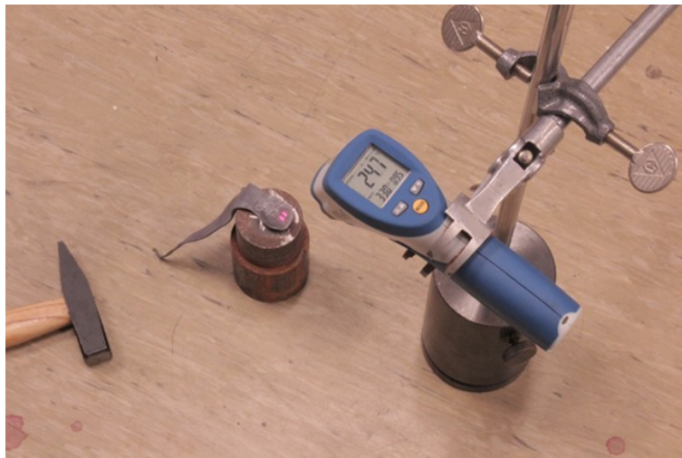
Abb. 2b: ... und nach den Hammerschlägen.