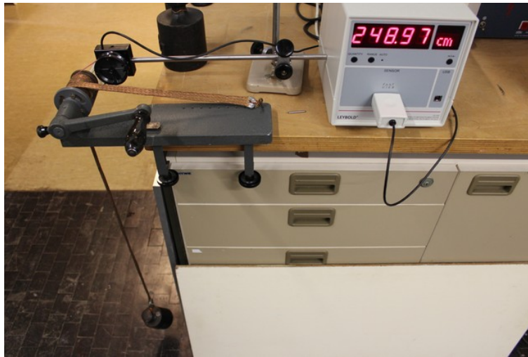
Abb. 3: Versuchsaufbau ohne Kraftmessgerät

Versuch an einem Tisch mit mind 90 cm Höhe befestigen, ansonsten den Aufbau auf dem Tisch stabil verlängern. Für quantitative Messung Kraftmessgerät integrieren. Kalorimeter mit destilliertem Wasser füllen und ggf. vorher auf 5\text{ K} unter Raumtemperatur abkühlen. Thermometer einführen, es reicht max. 1 Umdrehung zum Abdichten. Schon 10 Umdrehungen bei einer angehängten Masse von 5\text{ kg} lassen die Temperatur messbar steigen.