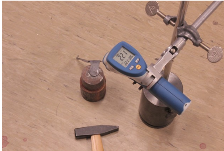
Abb. 1: Versuchsaufbau