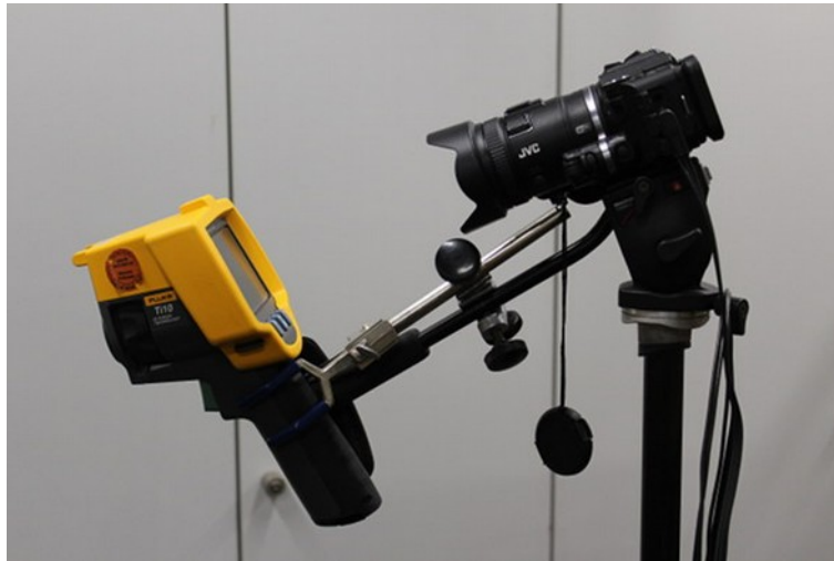
Abb. 1: Wärmebildkamera vor Präsentationskamera montiert