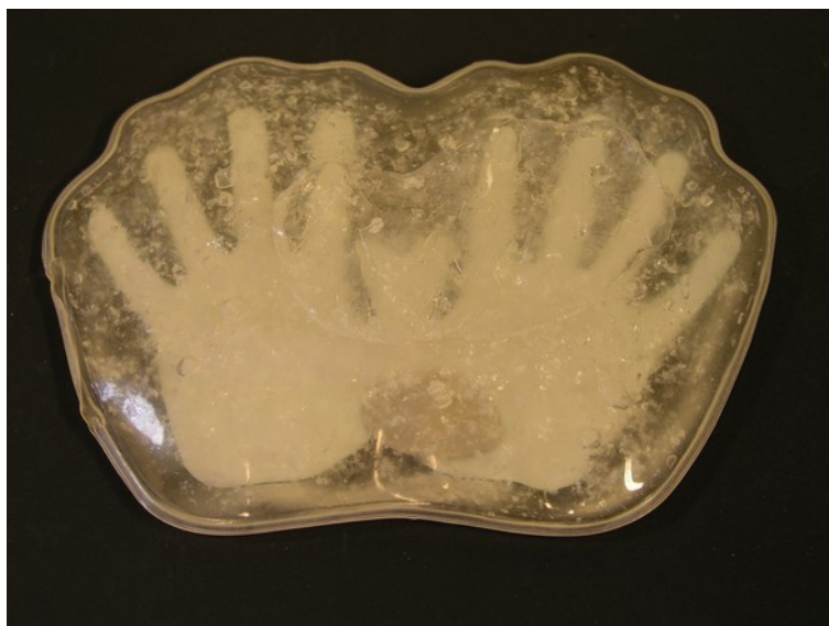
Abb. 3: Der Handwärmer im flüssigen Zustand