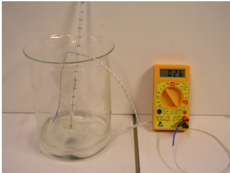
Abb. 2: Der Handwärmer im Wasserbad – für den Versuch besser einen isolierten Topf verwenden.