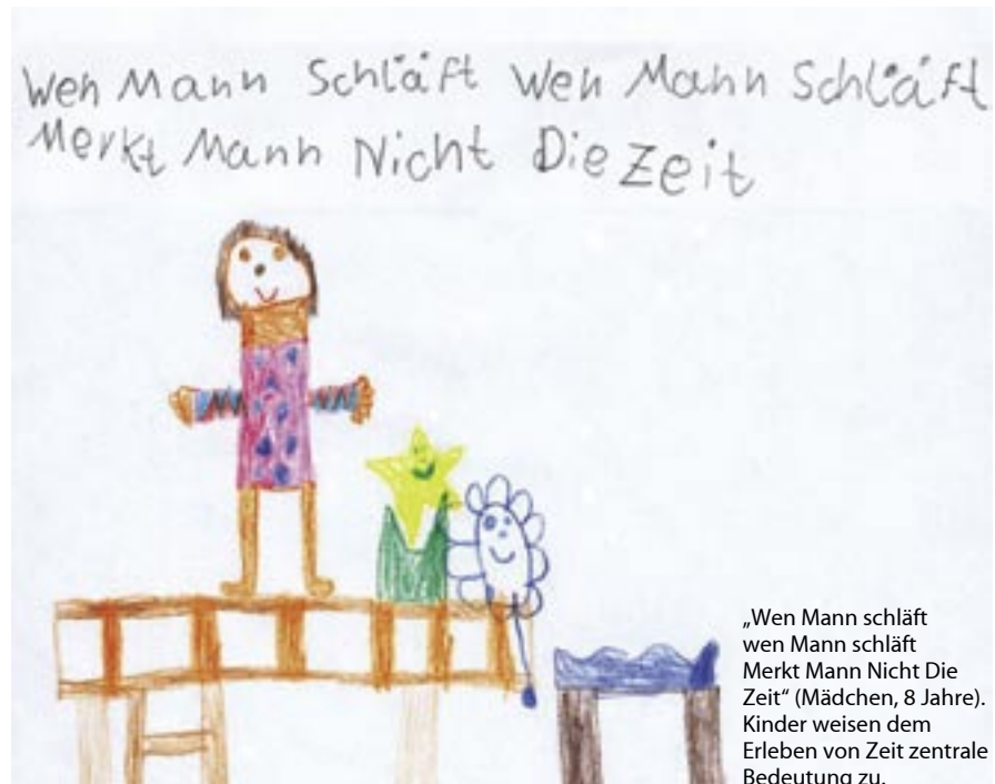
„Wen Mann schläft wen Mann schläft Merkt Mann Nicht Die Zeit“ (Mädchen, 8 Jahre). Kinder weisen dem Erleben von Zeit zentrale Bedeutung zu.

Als besonders geeignet hierfür können Angebote zur Kinderbiografie und zum Zeiterleben ausgemacht werden. Darüber hinaus sollte jedes Kind individualisierte Lernangebote erhalten, anhand derer es zu spezifischen Aspekten von Zeit vertiefend arbeiten kann. Binnendifferenzierungen sollten somit nicht nach vorab vorgenommenen „Zuweisungen“ der Kinder zu vermeintlichen Entwicklungsstufen oder Begabungskategorien, sondern individuumbezogen strukturiert werden.